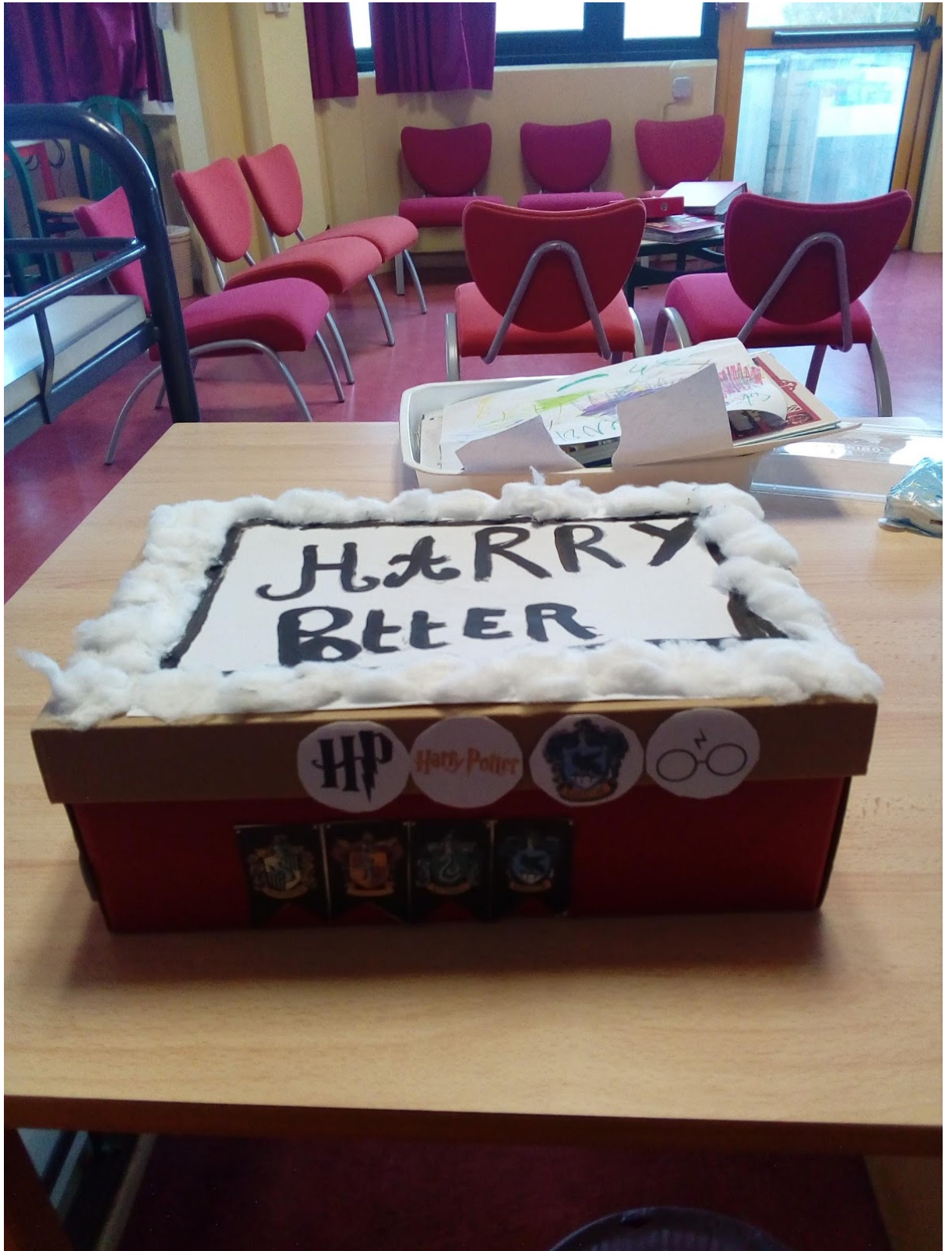
10. Boîte de lecture (photo n°1)