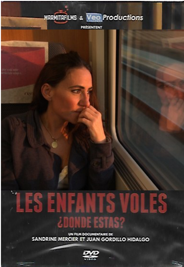
Pochette du DVD vidéo du documentaire., Les enfants volés - ¿Dónde estás? , Marmitafilms & Veo productions, 2012

Extrait du documentaire Les enfants volés - ¿Dónde Estás ?