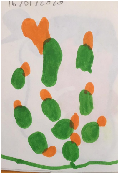
Dessin de Louis à son 1 er atelier