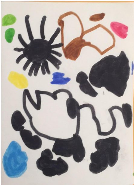
Dessin de Louis à son 3 ème atelier