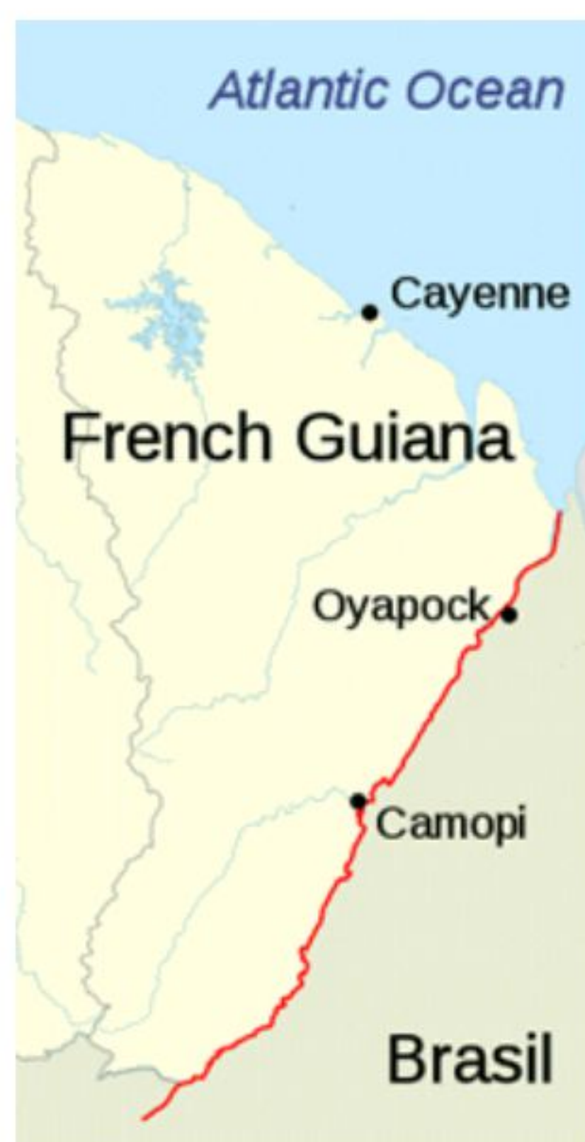
Figure 1: Région du Haut Oyapock