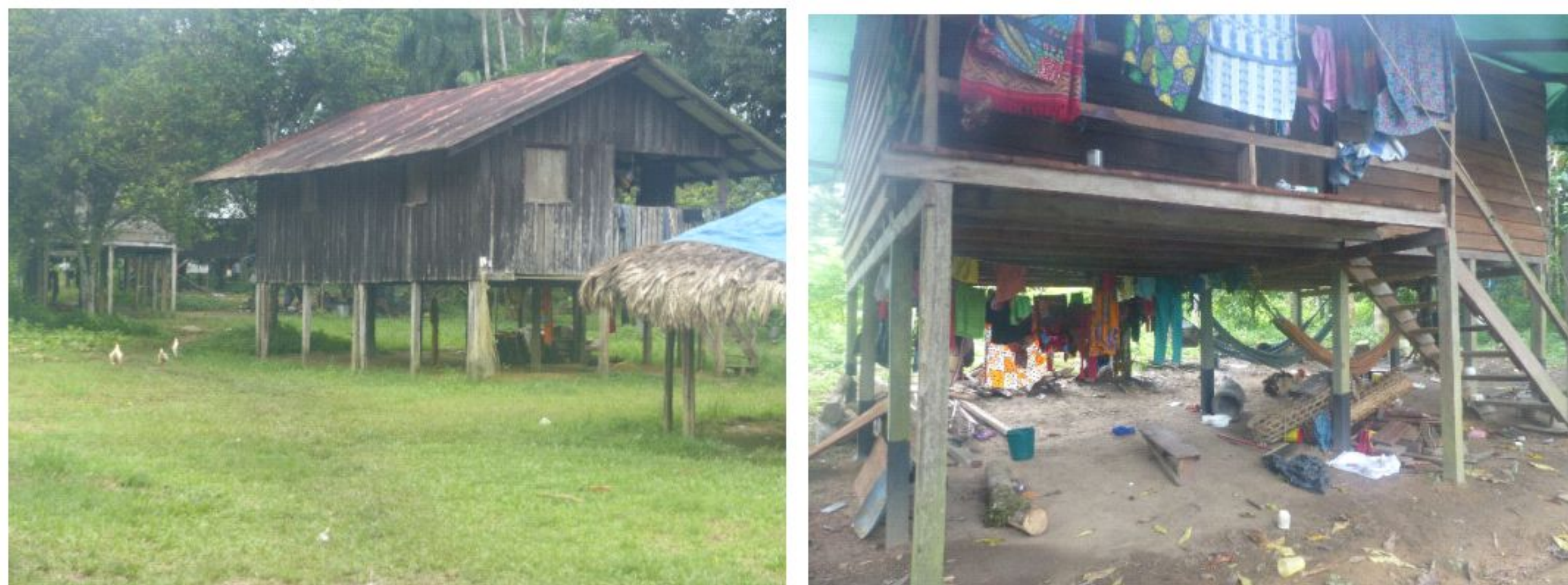
Figure 3: Carbet traditionnel amérindien à Trois-Sauts

Trois-Sauts, les seuls services publics sont assurés par l'école, le dispensaire et le Parc Amazonien (Fig.2).