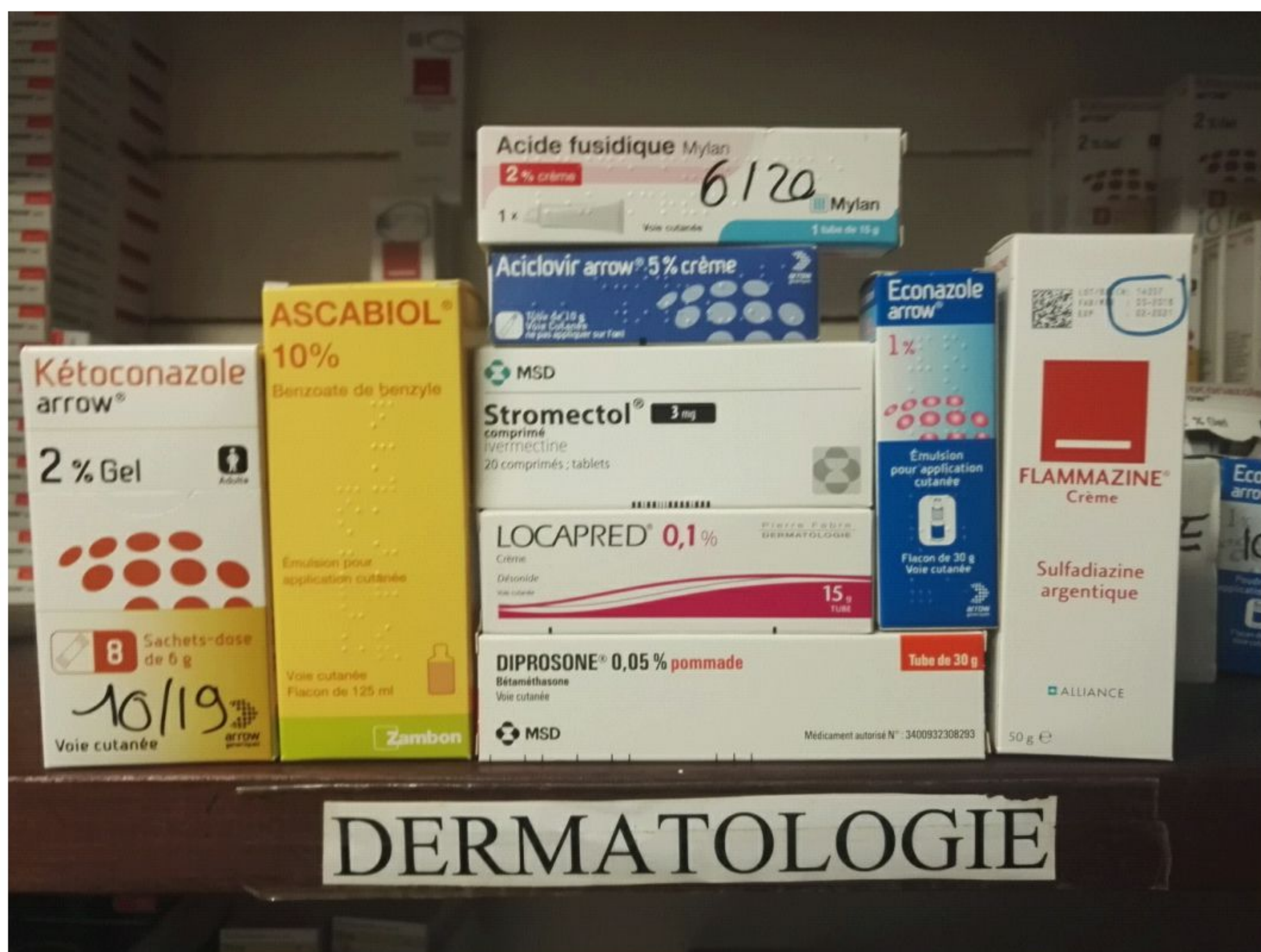
Figure 4: Médicaments dermatologiques disponibles au CDPS de Camopi