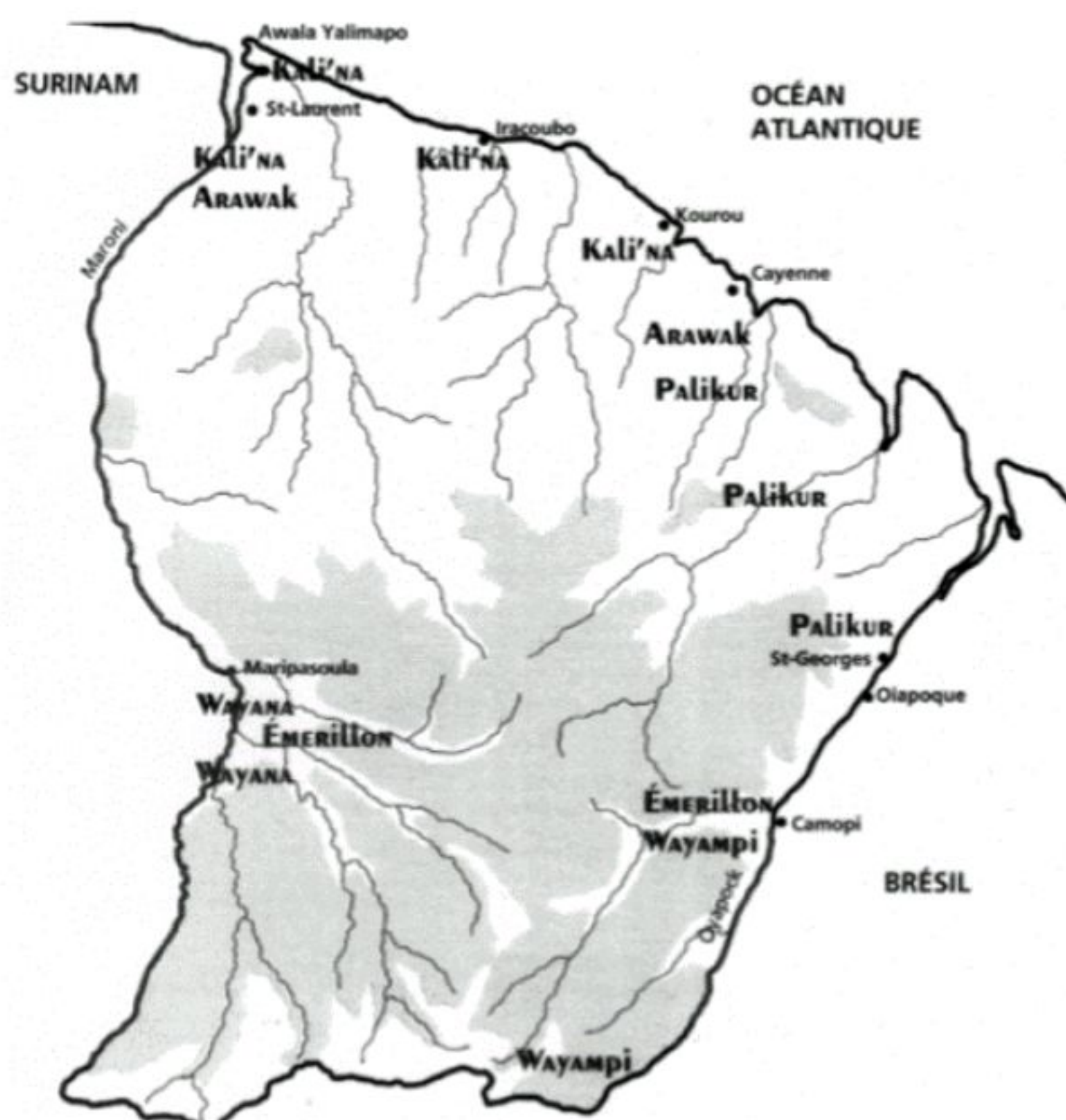
Figure 5: Répartition des ethnies Amérindiennes en Guyane Française

La Guyane Française est le seul territoire européen permettant l'étude épidémiologique d'une population amérindienne. On compte environ 9000 Amérindiens en Guyane regroupés dans 6 différentes ethnies: Kali'na, Arawak, Palikur, Teko ou émerillons, Wayāpi , et Wayana (Fig.3).