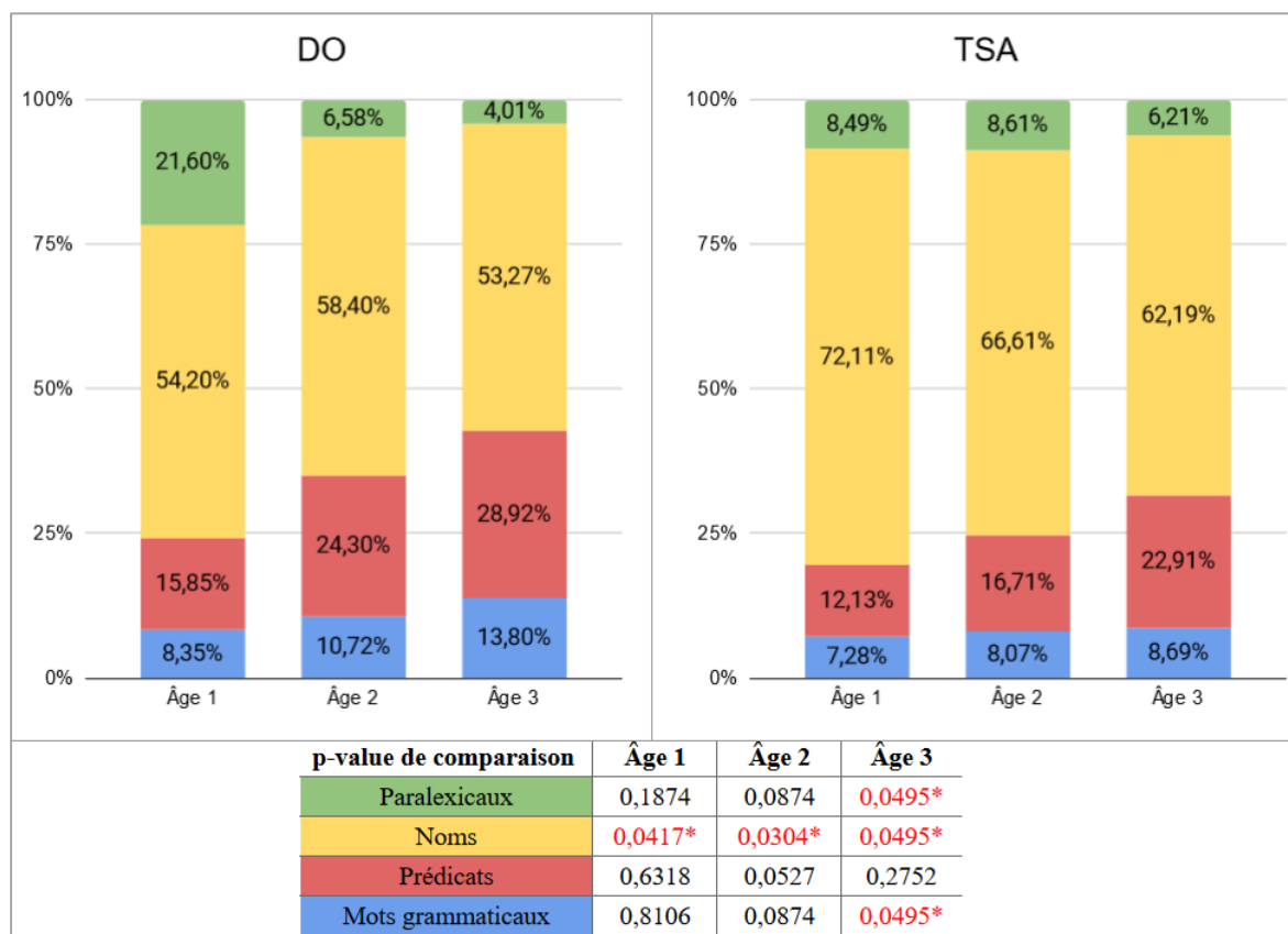
Figure 3 : Composition du lexique observé et comparaisons des moyennes.

Chez les enfants avec DO, la proportion d'items paralexicaux dans le lexique expressif chute de 21,60% à 6,58% puis 4,01% entre les classes d'âge 1, 2 et 3. Tandis que chez les enfants avec TSA, la proportion d'items paralexicaux dans le vocabulaire expressif reste assez stable avec des proportions de 8,49%, 8,61% et 6,21%. En classe d'âge 3, les proportions d'items paralexicaux dans le lexique total montrent une différence suggestive ( p=0,0495 ). Les enfants avec TSA conservent une proportion stable d'items paralexicaux dans leur lexique, contrairement à l'amenuisement observé chez les enfants avec DO.