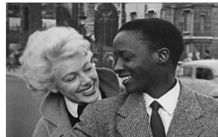
Réalisé par Paulin SOUMANOU VIEYRA & SARR Mamadou

La censure demeure, plus politiquement mais économiquement