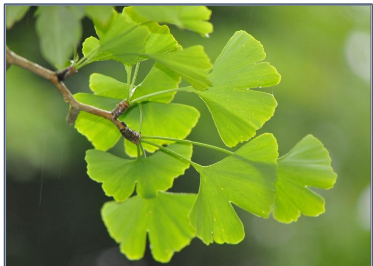
Fig. 4 – Ginkgo biloba

Le ginkgo, de la famille des Ginkgoaceae et également connu sous le nom d'« arbre aux quarante écus », est un arbre dioïque à feuilles caduques d'origine orientale, seul survivant d'un ordre qui fut largement représenté jusqu'à la fin de l'ère tertiaire. Il est caractérisé par des organes reproducteurs particuliers et