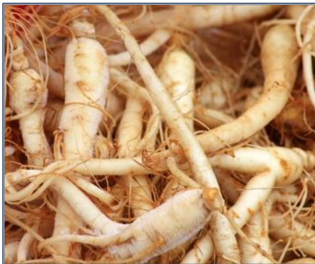
Fig. 5 – Panax ginseng

Le ginseng, de la famille des Araliaceae , est une petite plante à feuilles palmatilobées, à ombelles de fleurs blanches et à baies rouges. Il est spontané dans les zones montagneuses du Népal à la Mandchourie, de la Sibérie orientale à la Corée, mais ses gîtes ont été surexploités. Il a laissé la place, pour l'essentiel, à un ginseng de culture (Corée, Chine).