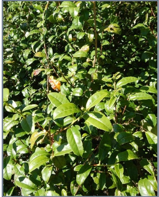
Fig. 11 – Camellia sinensis

En culture, les théiers sont régulièrement taillés dans le but de les maintenir à environ 1,2 m de hauteur afin d'en faciliter la récolte. Celle-ci est le plus souvent faite à la main : on récolte en effet uniquement le bourgeon terminal non épanoui et les premières feuilles, jeunes et souples.