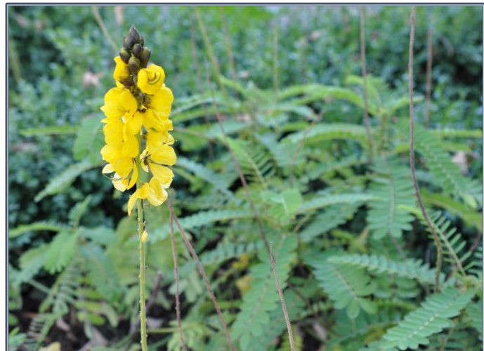
Fig. 10 – Cassia senna

Les fleurs, 4-cycliques 5-mères, zygomorphes, ont un calice en quinconce, une corolle de pétales jaunes veinés de brun à préfloraison imbriquée ascendante, et un androcée partiellement staminodial.