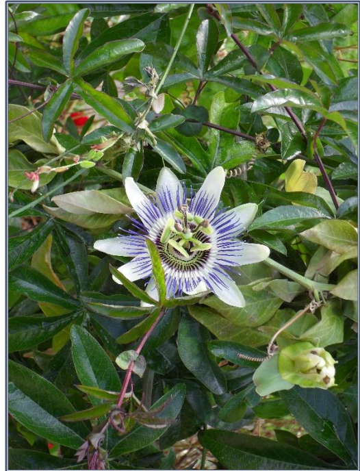
Fig. 9 – Passiflora incarnata

Les fleurs sont solitaires et de grande taille. Elles sont caractérisées par 5 sépales épais blancs sur la face inférieure, par 5 pétales blancs, et par une double couronne d'appendices pétaloïdes rouge pourpre sur leur partie extérieure. Elle est également caractérisée par des étamines à anthères orangées et par un ovaire 1-loculaire à trois branches stigmatiques.