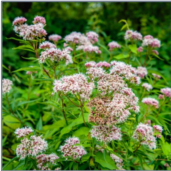
Fig. 12 – Valeriana officinalis

Valeriana officinalis , de la famille des Caprifoliaceae , est une espèce regroupant, à l'état naturel, plusieurs sous-espèces différant entre elles par leur degré de ploïdie. Le type diploïde, 2n = 14 ( V. officinalis ), est une herbe vivace à tige creuse et cannelée portant des feuilles en rosette à la base. Ces dernières, opposées sur la tige et pennatiséquées, comprennent de 11 à 19 folioles lancéolées, toutes de même largeur. Les fleurs zygomorphes, pentamères, blanches ou rosées, sont groupées en inflorescences cymeuses