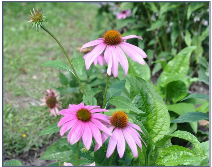
Fig.3 - Echinacea purpurea

Les racines, réduites en poudre, présentent les éléments microscopiques suivants :