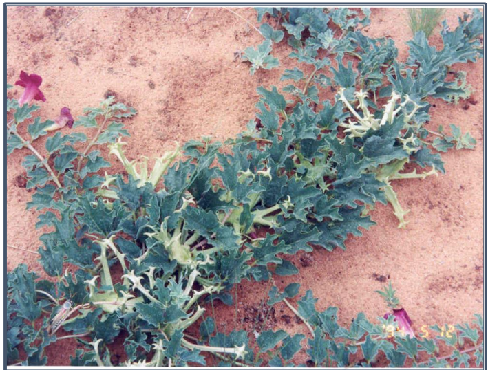
Fig. 6 – Harpagophytum procumbens

L'harpagophyton, de la famille des Pedaliaceae , est une plante pérenne : les tiges naissent d'un tubercule « primaire » relié à des tubercules « secondaires » formés par un réseau de racines fortement tubérisées. Les tiges, rampantes, portent des feuilles opposées vert bleuté. La plante est caractérisée par ses grandes fleurs solitaires dont le tube, jaune clair, s'évase en une corolle lobée d'un rouge violacé profond et par son fruit, une capsule ligneuse garnie d'aiguillons se terminant par une couronne de crochets courbes et acérés. Harpagophytum zeyheri et ses trois sous-espèces ( zeyheri , sublotanum et schijffii ) diffèrent légèrement du type procumbens par les caractères des fleurs et du fruit.