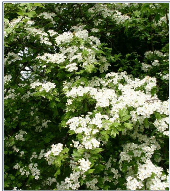
Fig. 2 – Crataegus oxyacantha

Les feuilles de Crataegus nigra et de Crataegus