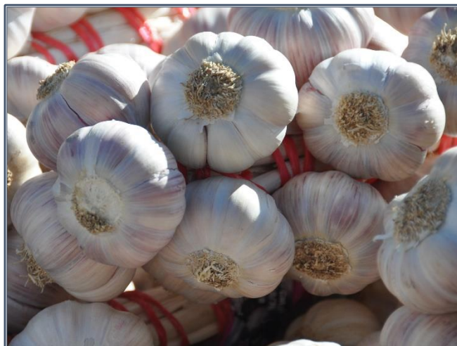
Fig. 1 – Allium sativum

Petite plante herbacée vivace, l'ail, de la famille des Amaryllidaceae (anciennement Liliaceae ), est une espèce à feuilles linéaires engainantes et à ombelles globuleuses de fleurs rougeâtres ou blanches qui sont entourées d'une longue spathe caduque qui se termine en pointe. Son bulbe est formé de caïeux (plus communément appelés « gousses ») insérés sur un plateau aplati et entourés d'une tunique commune blanchâtre. L'odeur, plutôt faible, se développe en forte odeur soufrée lorsque les tissus sont lésés (16).