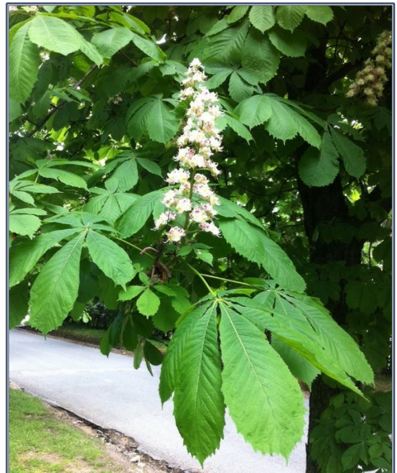
Fig. 7 – Aesculus hippocastanum

Le fruit est une capsule épineuse loculicide, assez souvent monosperme. La graine, globuleuse ou ovoïde, est pourvue d'un tégument luisant, marron, marqué par une large tache blanchâtre : le hile. Le tégument séminal, blanc crème dans le marron non mûr, devient acajou au cours de la maturation. Les cotylédons, huileux, charnus et amylacés, sont souvent soudés avec une ligne de suture plus ou moins visible. La saveur est âcre et amère (16).