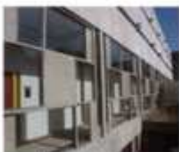
Rénovation de Couvent de la Tourrette à Évreux (2006)