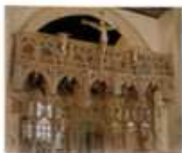
Rénovation du Jéré de la Chapelle Saint-Fiacre du Faouët (2001)