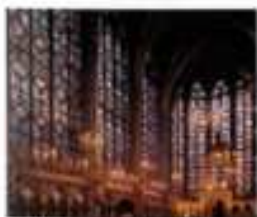
Restauration des vitraux de la Sainte-Chapelle de Paris (2008-2015)