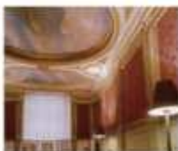
Rénovation du Parlement de Bretagne à Rennes (2002)