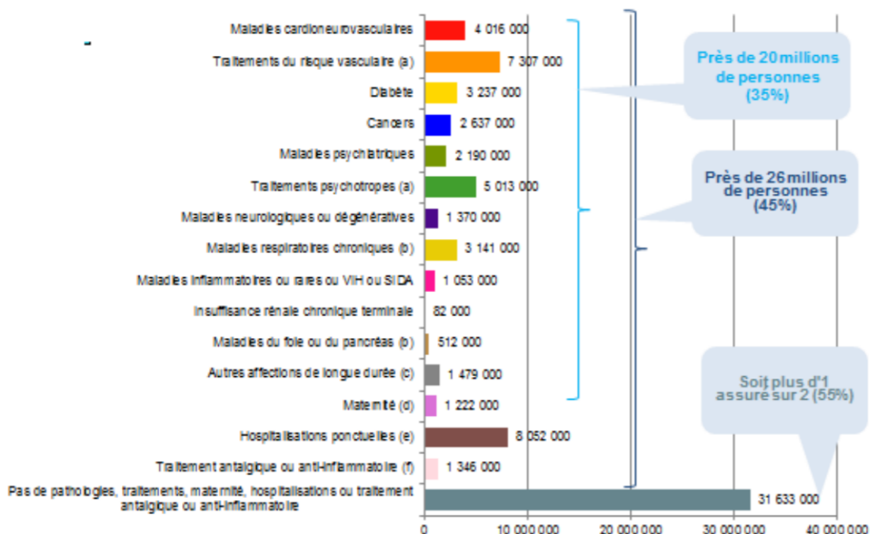
Figure 1 : Nombre d'assurés ayant des maladies chroniques et traitements chroniques

En France, la part des personnes âgées de plus de 60 ans passerait d'un quart en 2015 à un tiers de la population en 2040. Avec l'augmentation de l'espérance de vie, la prévalence des personnes âgées atteintes de pathologies chroniques ne cesse d'augmenter. Les limitations fonctionnelles entraînées par ces maladies risquent de faire passer le nombre de personnes dépendantes de 1,2 million en 2012 à 2,3 millions en 2060 7 .