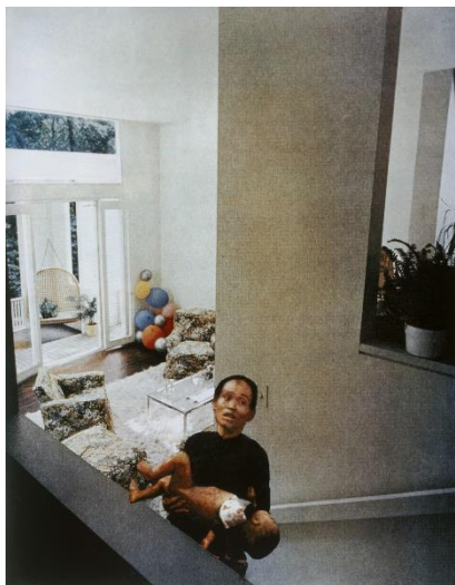
Figure 1 : Martha ROSLER, Balloons de la série House Beautiful: Bringing the War Home , photographie, 1967-72, MoMA collection