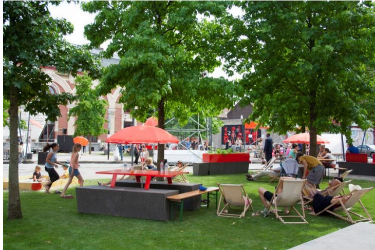
Figure 9 : La place Faidherbe, projet participatif mené par le collectif Faubourg 132, Roubaix, design, 2016

meublement urbain et surtout de la végétation. Il y a là une appropriation de l'espace par les habitants.