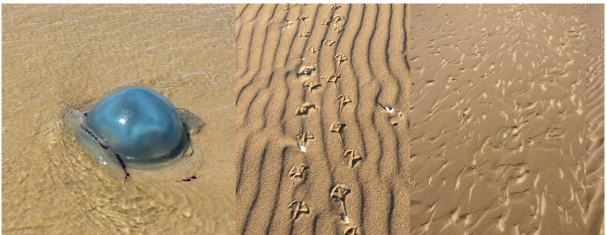
Figure 10 : Marche jusqu'au sémaphore de Sangatte, découverte du paysage à travers les divers motifs dessinés par le vent et l'eau

Leila Willis est une artiste plasticienne qui nourrit sa recherche de voyages et vient créer des ubiquités entre différents espaces et des mélanges culturelles. Elle s'attache aux mouvements, aux rythmes et au phénomène de multiplication. L'artiste affectionne tout particulièrement le monde marin avec un intérêt pour les changements d'échelle. Au cours de sa résidence, l'artiste s'est attaché à faire découvrir l'environnement du village vacances aux participants à travers les paysages et le monde marin. Leila Willis a également proposé un atelier autour du land art et des artistes de la marche comme Anish Pullton.