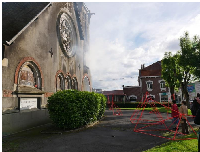
Figure 8 : La Flèche, projet participatif mené par le collectif Faubourg 132, Liévin, installation, 2017

soit de manière usuel ou esthétique. D'abord le projet de La Flèche au Temple Liévin. Ici c'est le centre d'art Arc-en-ciel qui les a contactés pour développer une résidence sur le territoire de Liévin autour du patrimoine du temple protestant de la ville. Ce lieu en pleine réhabilitation allait devenir un lieu artistique et culturel, les acteurs du territoire cherchaient par cette résidence à valoriser le patrimoine de ce lieu tout en amorçant sa futur fonction. Le collectif et les participants ont choisi de s'attacher à l'histoire du lieu et plus particulièrement à la disparition de sa flèche dans les années 80. C'est alors la création d'une installation artistique qu'entreprend le groupe. Comme l'explique Léa Barbier, ce projet est encore une question de perception de son environnement puisque les participants n'avaient jusque là pas fait attention à ce lieu faisant pourtant partie de leur paysage quotidien. L'installation artistique était alors le moyen de valoriser le patrimoine de la ville et inviter à venir le découvrir.