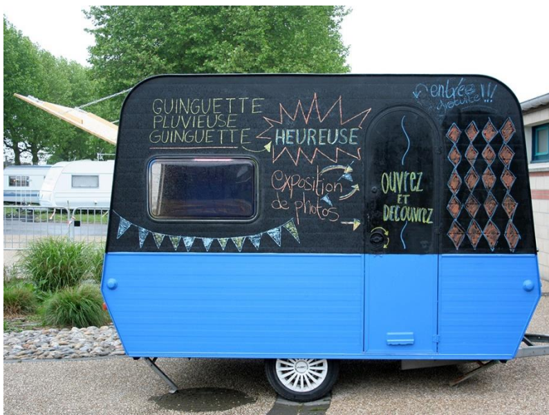
Figure 12 : Collectif Faubourg 132, projet Caravane Tour, Guinguette, Résidence M.i.A.A. 2016