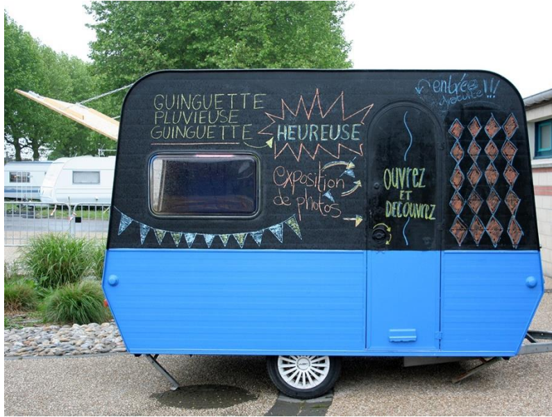
Figure 12 : Collectif Faubourg 132, projet Caravane Tour, Guinguette, Résidence M.i.A.A. 2016