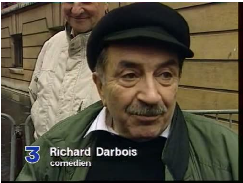
Journal télévisé 12 h 45, France 3 - 28.12.1994 - 13:23:54.