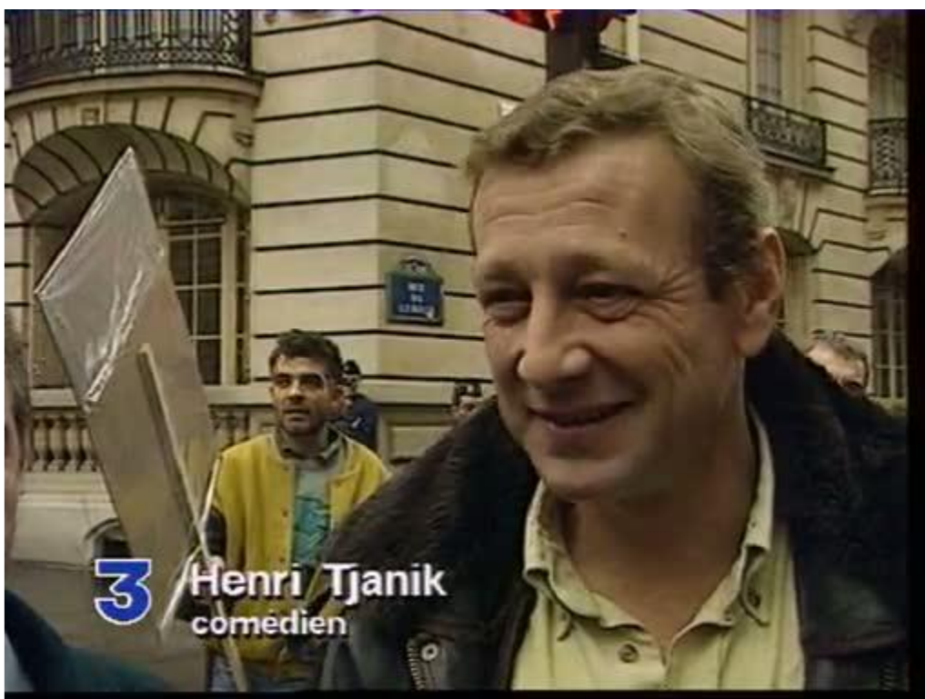
Journal télévisé 12 h 45, France 3 - 28.12.1994 - 13:23:59