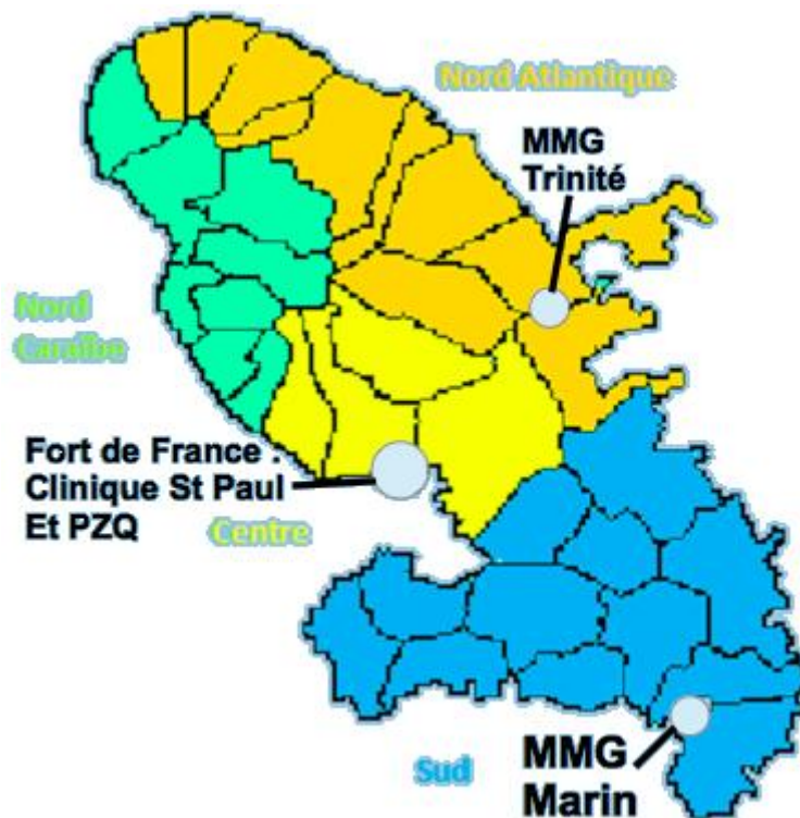
Organisation des PDSA en 4 secteurs (61)