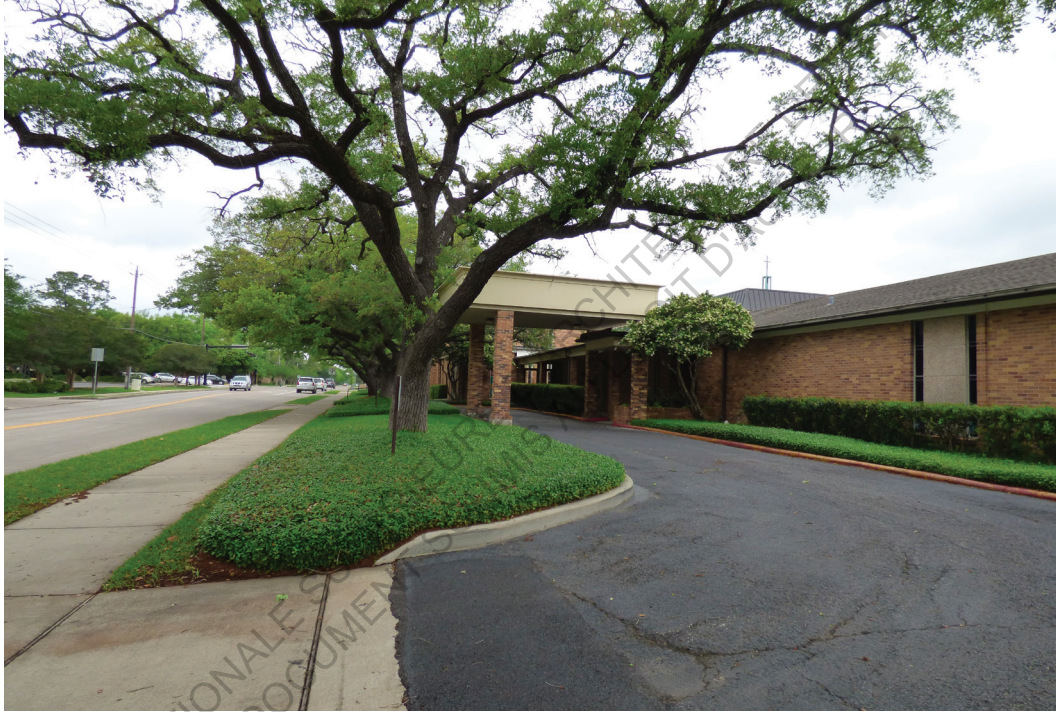
Bellaire United Methodist Church, Houston photographie personnelle 6 avril 2018 11h50