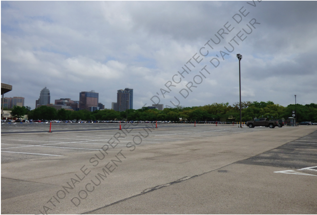
Rice University, Houston 6 avril 2018 14h30