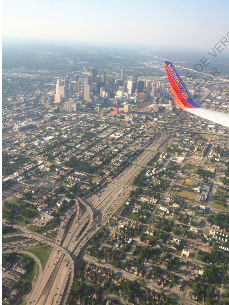
Houston vu du ciel 2 mai 2018