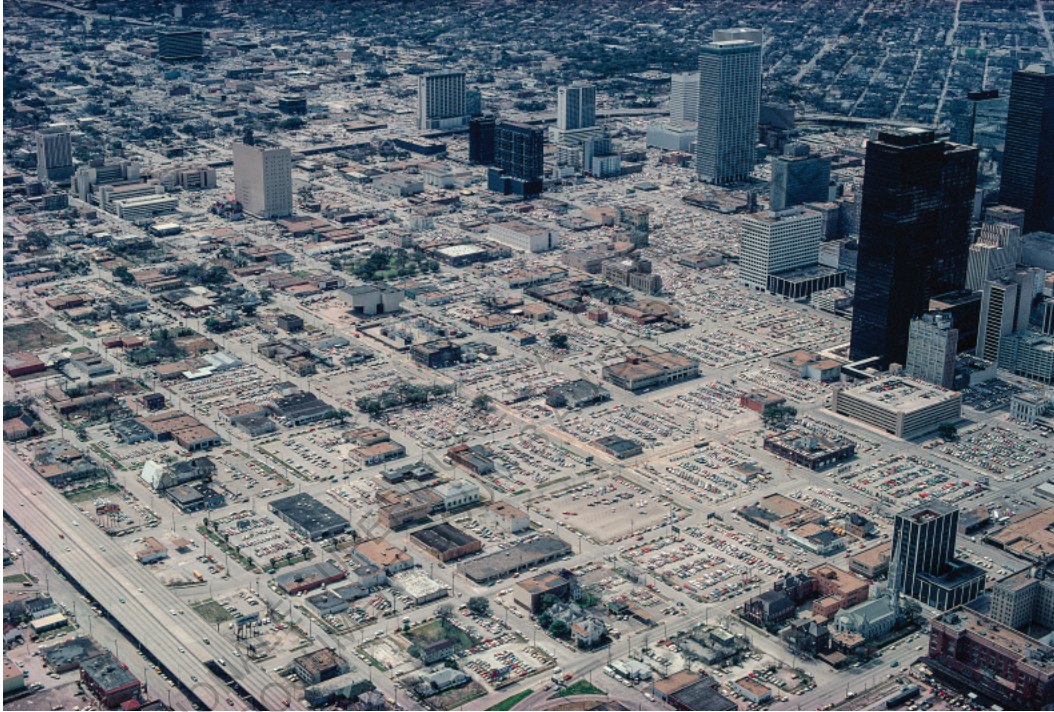
Downtown Houston 1978