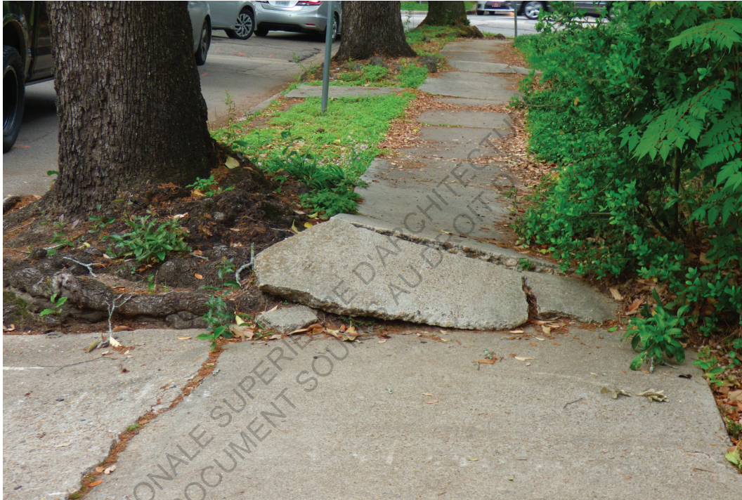
Mandell Street, Houston 8 mars 2018 15h40