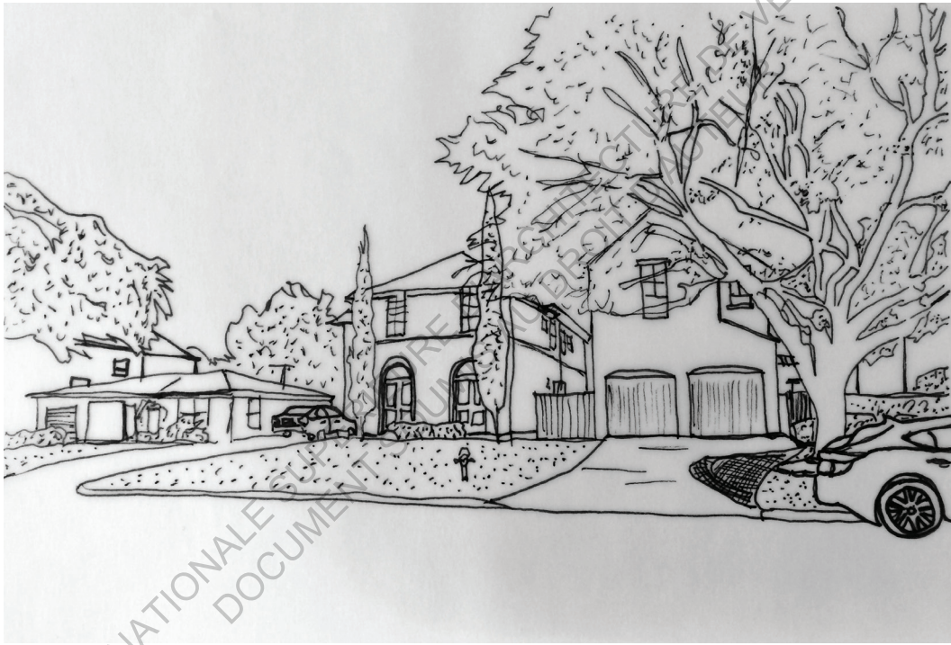
lone Street, Houston croquis personnel 8 mai 2018 11h30