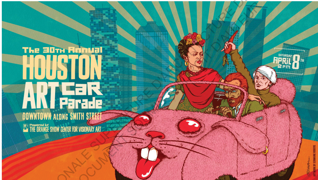
ROGERS Jermaine, Houston Art Car Parade 2017 30th , 2017