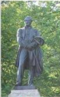
▲ Statue d'Eugène Ier Schneider, 1878, Le Creusot.

J. Huret, Enquête sur la question sociale en Europe , 1897.