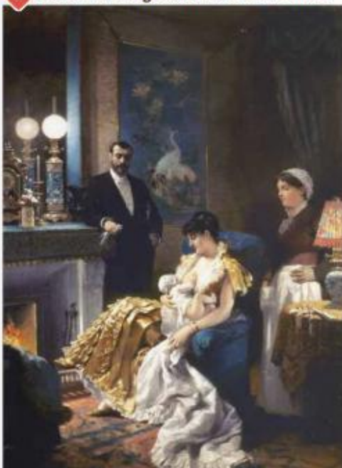
▲ Édouard Debat-Ponsan, Avant le bal , 1886, huile sur toile, 87 x 65 cm (musée des beaux-arts de Tours).