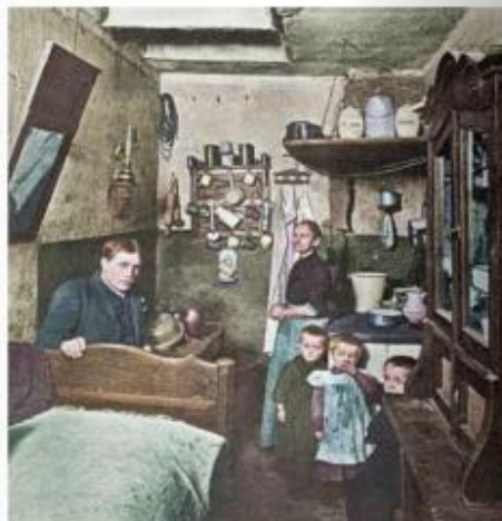
▲ Photographie colorisée, Berlin, 1903.

Le socialisme : idéologie qui dénonce l'organisation de la société industrielle et qui souhaite la mise en place d'une société plus égalitaire.