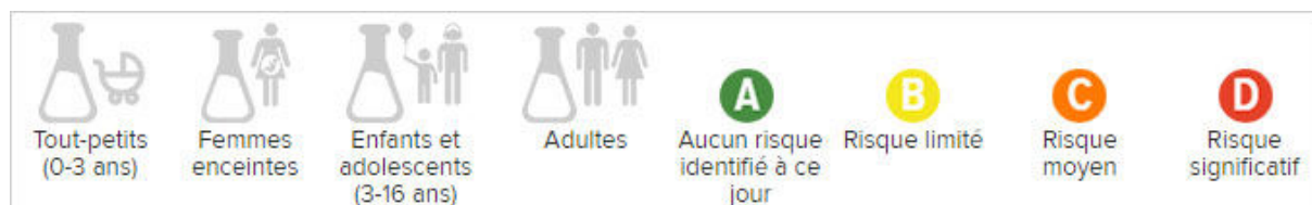
Figure 6 - Les pictogrammes et les codes couleur utilisés dans l'application

Son application classe ses résultats avec des codes couleurs mais également en fonction de l'âge de la personne concernée. En effet, l'impact d'un ingrédient n'est pas le même en fonction des tranches d'âges.