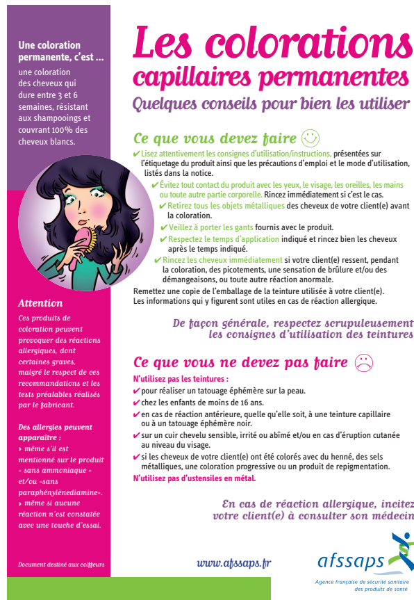
Figure 12 - Affiche réalisée par l'AFSSAPS en 2010 concernant les recommandations d'utilisation des colorations capillaires.

Deux documents ont également été rédigés. Ils énumèrent les recommandations à l'attention du consommateur[81] et aussi à l'attention du coiffeur [80].