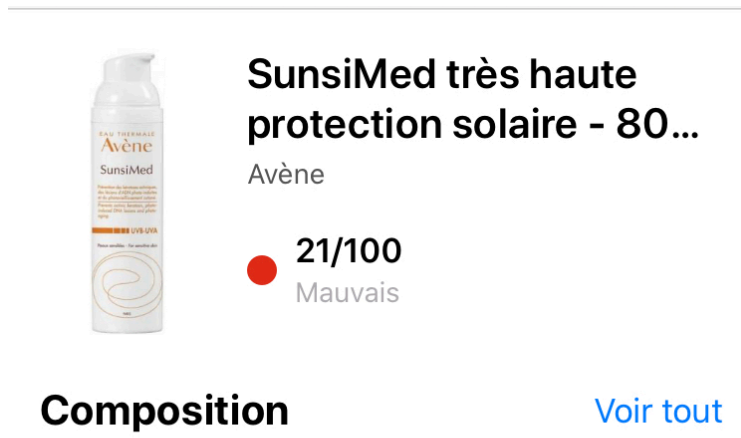
Figure 7 – Résultat sur l'application YUKA après scan du produit AVENE SUNSIMED

En effet, lorsque nous avons scanné le produit « Sunsimed » du laboratoire Avène, l'application Yuka affiche « mauvais » avec une note de 21/100 alors que l'application Quelcosmetic lui attribue la note de A soit la meilleure note, et le qualifie de « sans risque ».