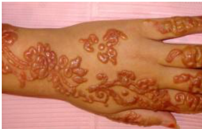
Figure 13 - Cas d'un eczéma de contact après application de henné noir [83]

Dans certains cas même, la violence des réactions nécessite une intervention médicale urgente voire une hospitalisation.