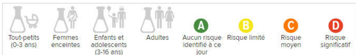
Figure 6 - Les pictogrammes et les codes couleur utilisés dans l'application

Son application classe ses résultats avec des codes couleurs mais également en fonction de l'âge de la personne concernée. En effet, l'impact d'un ingrédient n'est pas le même en fonction des tranches d'âges.