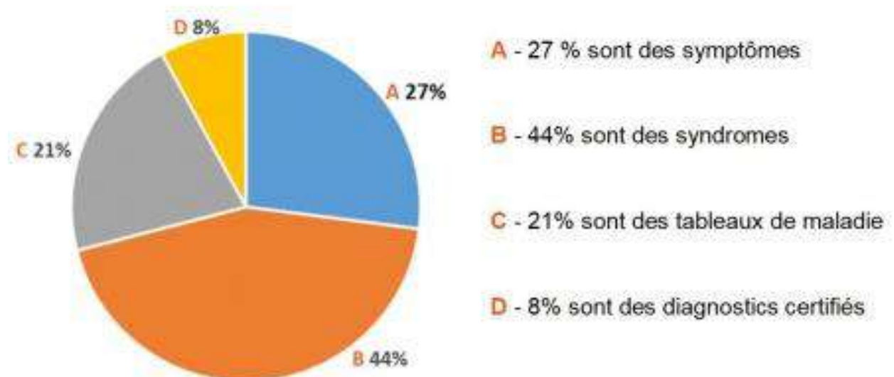
Figure n° 3 : répartition des diagnostics en soins primaires [33]

Pour évaluer au mieux les risques et prendre des décisions adaptées, il est indispensable de nommer précisément la situation clinique observée, c'est à cela que sert le DRC.