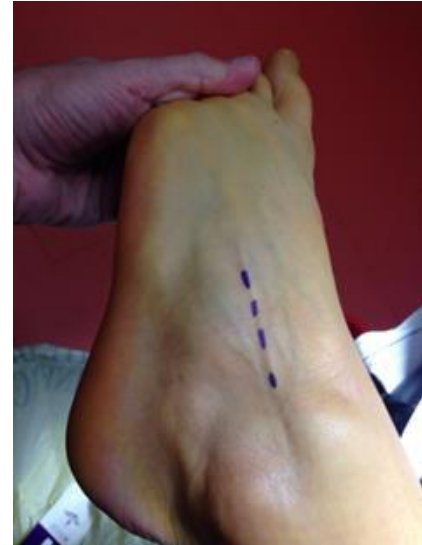
Figure 4 : repérage de la branche principale du nerf fibulaire superficiel

Des instruments arthroscopiques de bases sont nécessaires : colonne d'arthroscopie, arthroscopie de 4,0 mm à 30 °, shaver motorisé de 3,5 à 4,5 mm, instruments arthroscopiques standard. L'instrumentation spécifique est composée d'un strippeur pour prélever le greffon, de mèches canulées de 4 et 6 mm de diamètre, d'un endo bouton réglable et de 2 vis d'interférence. Aucun système de pompe arthroscopique ou de traction n'a été utilisé.