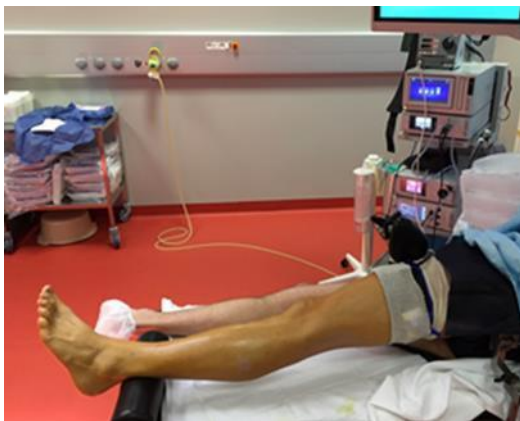
Figure 1 : Position pour l'arthroscopie antérieure

La chirurgie est pratiquée sous anesthésie générale associée à une anesthésie loco-régionale à visée antalgique réalisée sous contrôle échographique en préopératoire. Une antibioprophylaxie était mise en place trente minutes avant le début de la procédure. Le patient est en position latérale. Un garrot est placé à la racine de la cuisse. Le but de l'installation est de pouvoir mettre le membre inférieur en position d'arthroscopie antérieure, puis de prise de greffe et enfin d'endoscopie latérale en mobilisant le membre inférieur (Figure 1, 2 et 3). La branche visible sous-cutanée du nerf fibulaire superficiel est repérée avec un marquage cutané par mise en inversion de la cheville. (Figure 4) (27).