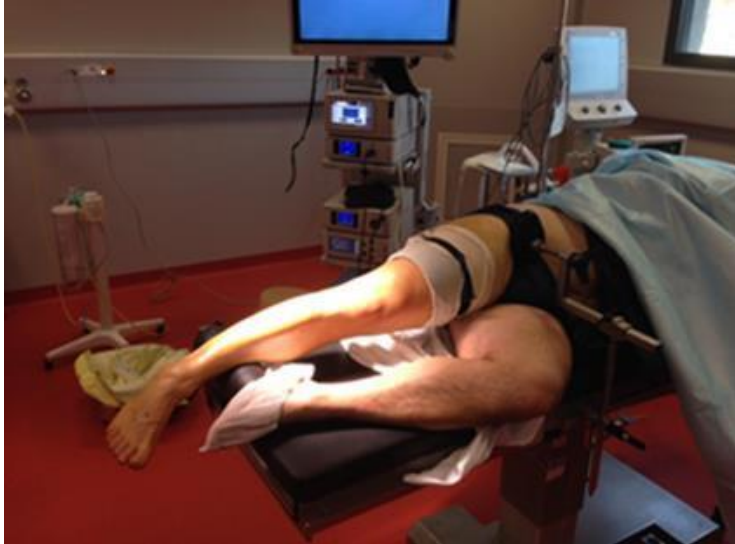
Figure 3 : position arthroscopie latérale