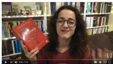
Le désaccord (image 5)

l'état interne l'ayant poussée à prendre la décision de lire le livre, mais en en accentuant au maximum les traits 93 . Voici les trois exemples d'expression mentionnés :