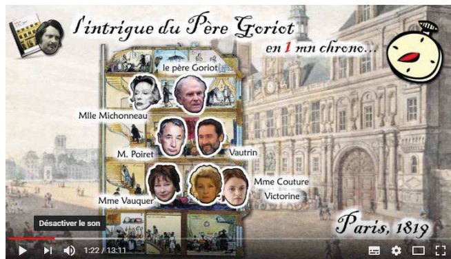
Vidéo de JPDepotte sur Le Père Goriot (Image 14)

maison, sur un arrière-plan extérieur contextualisant historiquement l'œuvre, et fait apparaître le visage de personnages ainsi que leur nom écrit à mesure qu'il les présente.