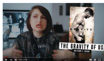
« Allez c'est parti » (image 7)