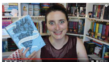
« Ca y est ! » (image 6)