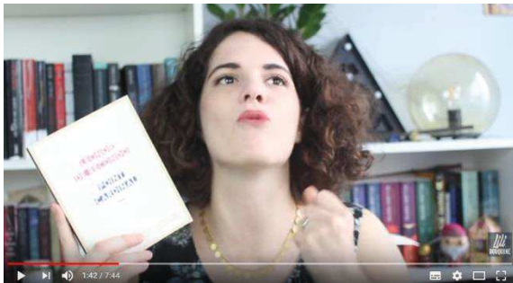
« Magni... » (image 3)