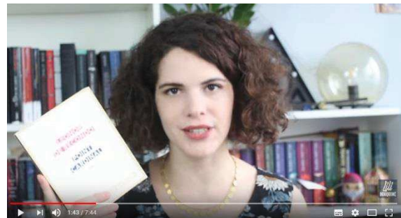
« ...fique », main retombée, regard franc (image 4)

Lorsqu’ Audrey se demande si le livre décrit vraiment un inceste, elle prend une mine mêlant l’hésitation, la réflexion, et le scepticisme 91 . Quand Moody s’exclame « ça y est » pour annoncer qu’elle s’est enfin lancée dans la lecture d’un livre dont on a beaucoup entendu parler, elle sourit, hausse les pommettes, ouvre de grands yeux, lance à la caméra un regard qui traduit à la fois une forme d’humour et d’auto-commentaire, de méta-communication – elle plaisante, par ce regard, sur le fait qu’elle a tardé à lire le livre 92 . Quand Nine dit « J’ai lu le résumé de celui-ci, il m’avait l’air plutôt pas mal, du coup je me suis dit allez c’est parti », elle prend une expression reflétant