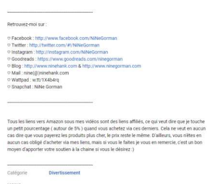
Barre d'information (Image 13)