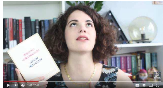
« Qui est juste... », main sur le cœur (image 2)