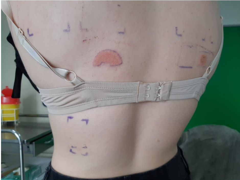
Figure 5. Lecture de patch-test à 72h chez une patiente utilisant le capteur Freestyle Libre ; positivité à un fragment d'adhésif du capteur glycémique Freestyle Libre (gauche) et positivité à l'isobornyl acrylate (droite).