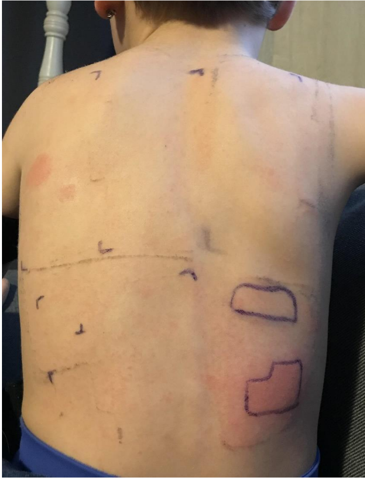
Figure 6. Lecture de patch-tests à 72h chez une jeune patiente utilisant le capteur Enlite ; positivité à un fragment d'adhésif du capteur glycémique Enlite (en bas à droite) et positivité à la colophane (en haut à gauche).