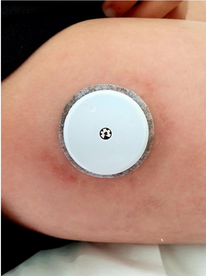
Figure 2. Lésions eczématiformes débordant autour du capteur glycémique Freestyle Libre chez un patient allergique à l'isobornyl acrylate.