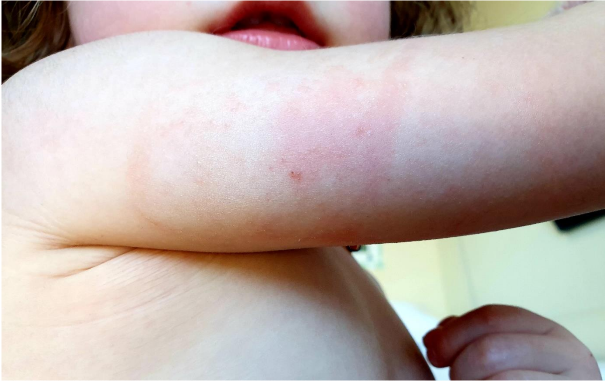
Figure 4. Xérose et érythème chez une jeune patiente présentant une dermite irritative de contact au capteur Freestyle Libre. Tous les tests cutanés sont revenus négatifs.