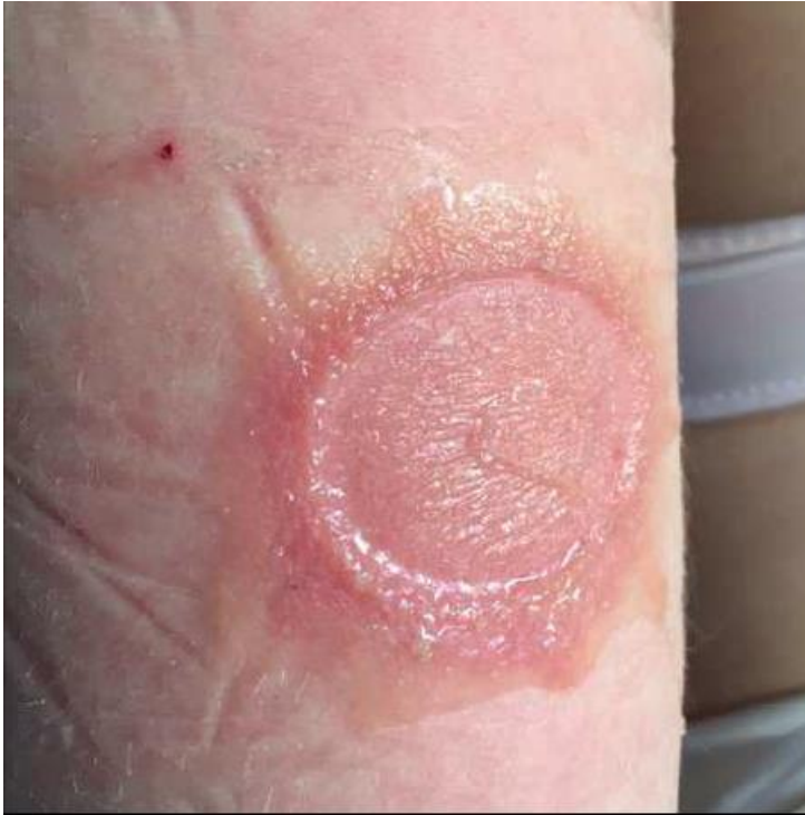
Figure 3. Eczéma de contact allergique. Aspect érythémateux, infiltré, débordant du pourtour du capteur, avec un important suintement, chez un patient allergique au Freestyle Libre par l'intermédiaire de l'isobornyl acrylate.