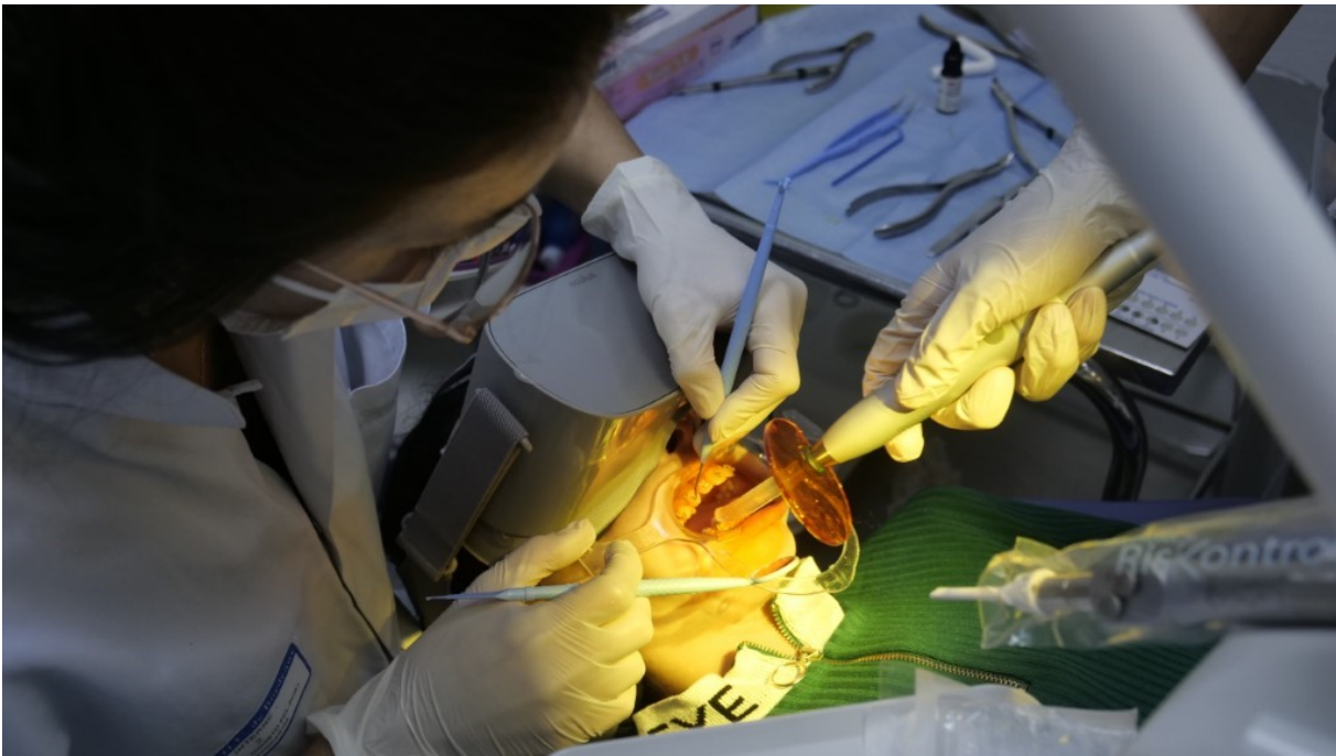
Figures 17, 18