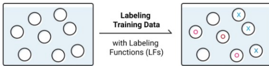
Figure 2: Fonction de labellisation de Snorkel

Snorkel est un outil de data programming créé par Ratner et al (2017) pour permettre à des utilisateurs de pouvoir construire facilement des données d'entraînements. Il a été bâti selon trois critères. Le premier est de pouvoir utiliser toutes les ressources disponibles, c'est-à-dire de permettre à l'utilisateur d'avoir des étiquettes venant de toutes les ressources faiblement supervisées à sa disposition. La deuxième est de créer des données d'entraînement comme interface pour l'apprentissage automatique. Le système doit être capable de modéliser les sources d'étiquette pour induire un seul étiquetage probabiliste pour chaque instance. Ces étiquettes sont utilisées pour entraîner un modèle discriminatif, qui va permettre de généraliser. Enfin le dernier critère est celui de l'efficacité, le système doit être capable de fournir rapidement des résultats avec un taux de fiabilité qui soit comparable à une annotation qui serait réalisée par des humains.