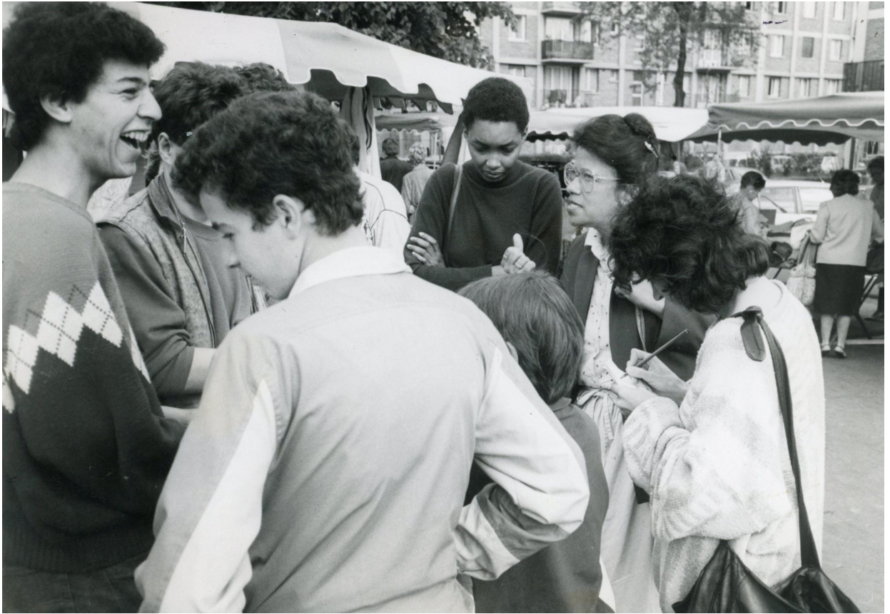
Dulcie September parlant à des jeunes du Chaperon-Vert en 1986. Archive ayant servi pour l'exposition « Dulcie September : je me souviens » présentée à la Mairie d'Arcueil en 2018.