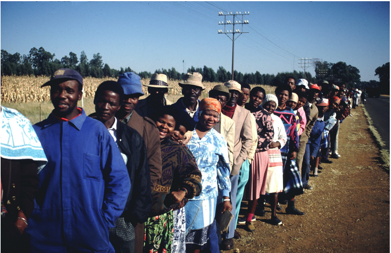
PHOTOGRAPHIE DE BRUCE CLARKE. PRÊTÉE PAR VIRGINIE BOGERS, UTILISÉE LORS DE L'EXPOSITION « DULCIE SEPTEMBER JE ME SOUVIENS »

longs séjours en Inde 187 où il s'investit dans un projet travaillant sur les questions de foule et de peuplement. Il est aussi invité en résidence par le Conseil Général de Guadeloupe pour des expositions sur le lien entre l'esclavage, le colonialisme et la mondialisation 188 .