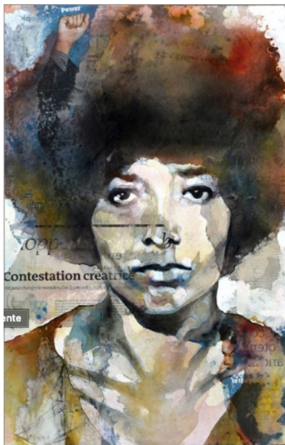
CONTESTATION CRÉATRICE (ANGELA)

Plus que de la peinture, l'oeuvre de Bruce Clarke est de l'art conceptuel qui traite de « l'histoire contemporaine, de l'écriture et de la transmission de cette histoire. Il souhaite que sa peinture stimule une réflexion sur le monde contemporain et la représentation qu'on en fait. » 189 . Son oeuvre renvoi à des thèmes historiques comme l'apartheid ou encore le génocide rwandais. Il met à l'honneur des corps, des animaux, des paysages ou des portraits, souvent avec un mot ou un bout de texte que l'on peut lire si l'on s'approche du tableau. Comme ici avec une oeuvre représentant Angela Davis 190 .