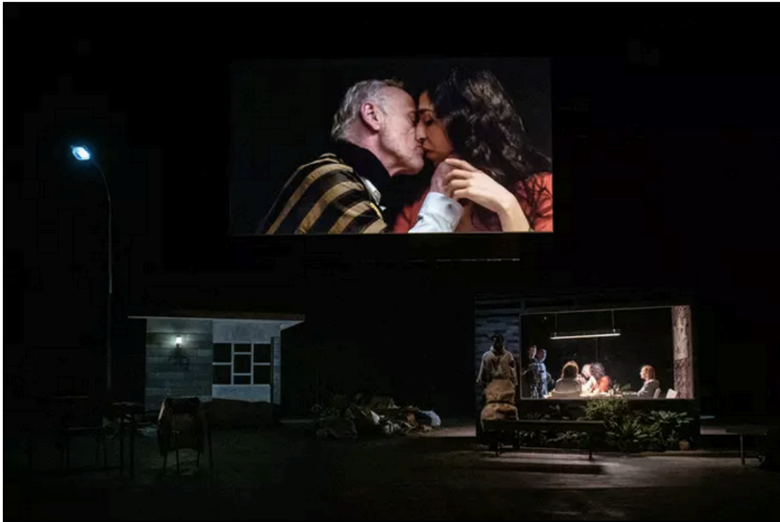
Figure 1 : Le dernier repas d'Agamemnon et de Cassandre. Oreste à Mossoul , épisode 1.