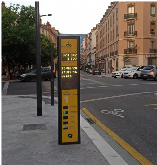
Figure 3 Exemple de borne comptant le nombre de vélos, ici à Grenoble

Cela va dans le sens d'une prise de conscience des enjeux du changement climatique de la part de la population en montrant directement ses impacts et ses conséquences grâce aux données récoltées sur le terrain par des objets connectés. Et cela va également dans le sens d'un tourisme intelligent. Car la crise écologique ne doit pas faire disparaître toutes les possibilités de la société actuelle mais seulement nous faire prendre conscience des impacts de nos habitudes et repenser nos modes de vie en conséquence.