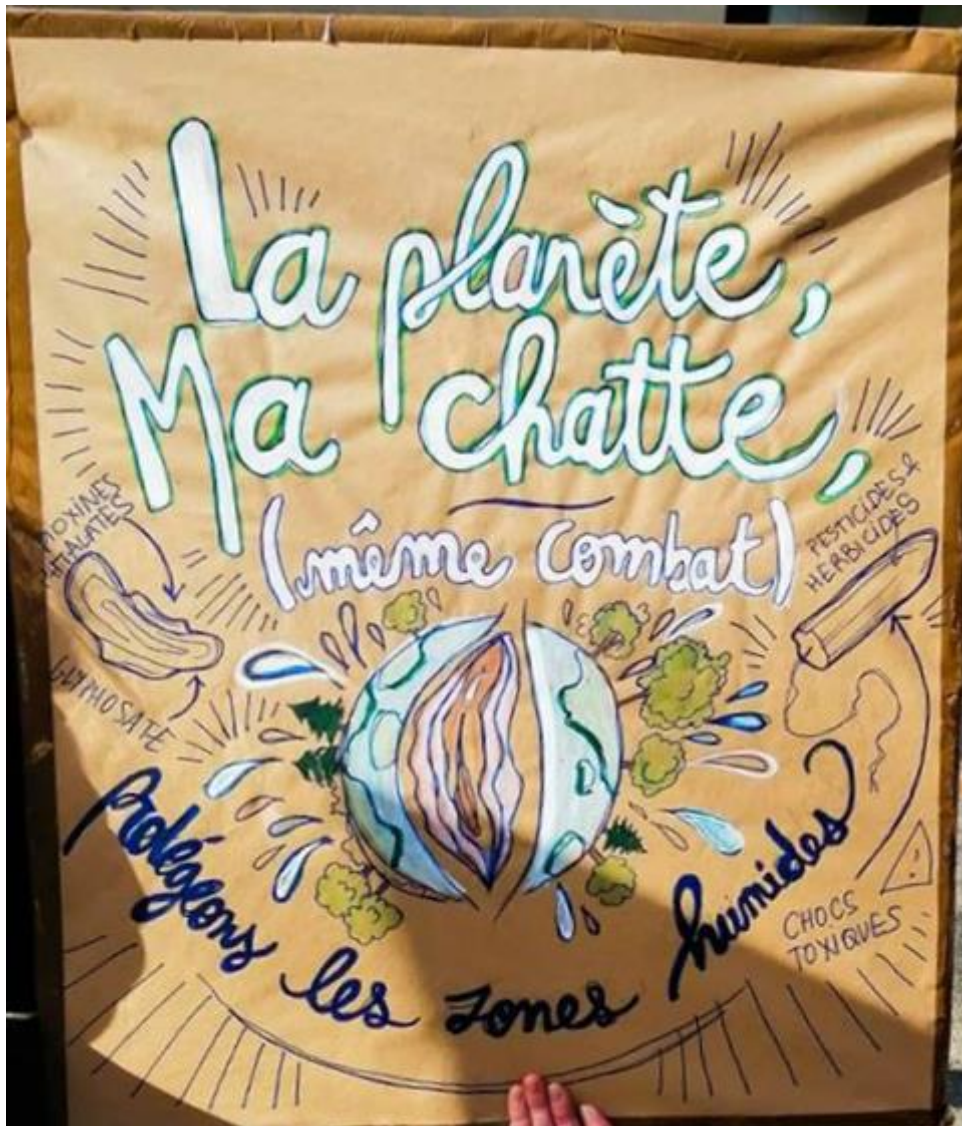
Photographie d'une pancarte réalisée pour la manifestation du 8 mai, journée nationale du droit des femmes, qui a eu lieu à Grenoble et à laquelle j'ai participé. On peut constater ici que le corps féminin, et notamment la vulve, fait coïncider les revendications sociales avec les revendications environnementales.