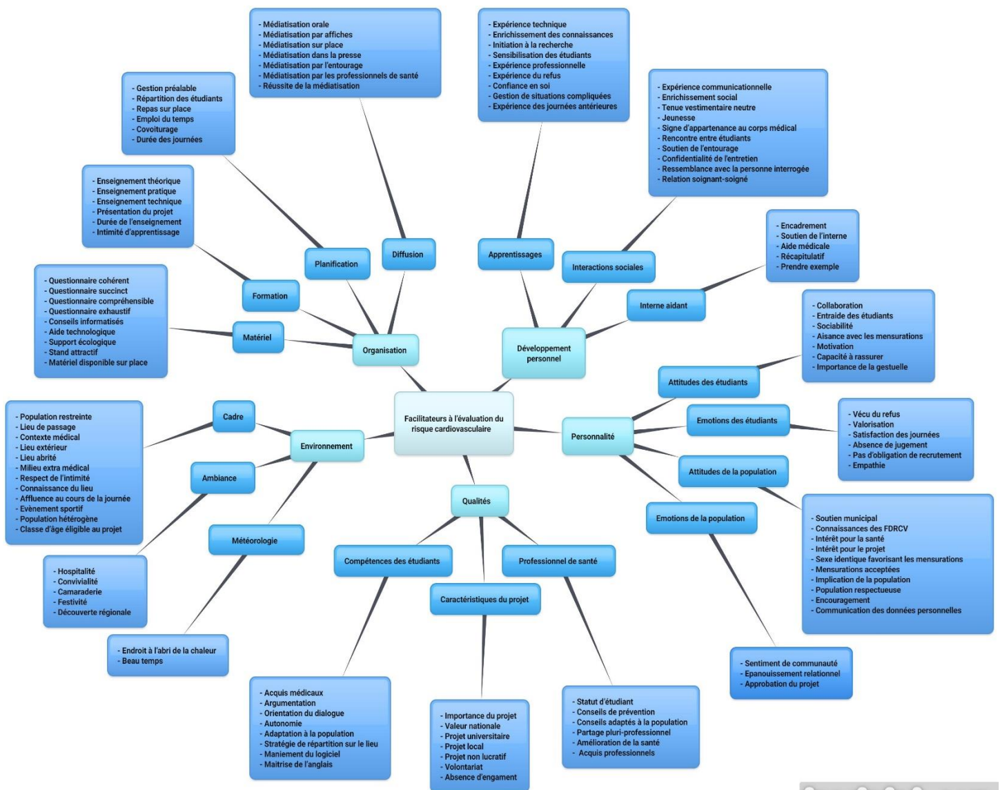
Figure 1. Schéma heuristique de l'analyse thématique

L'analyse thématique a mis en évidence 441 codes ouverts. Ils ont pu être exprimés en 132 codes axiaux, eux-mêmes regroupés en 21 codes sélectifs puis en 5 supers-codes. Une carte heuristique (figure 1) présente les résultats du codage et le tableau correspondant est disponible en annexe 6. Une seconde carte expose les perspectives d'amélioration proposées par les étudiants (figure 2).