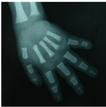
Figure 3 : Radiographie de l'enfant D1.

L'analyse moléculaire réalisée a posteriori chez ces deux patients identifie la délétion des exons 5 à 7 de PIGN à l'état homozygote. L'analyse parentale n'est pas réalisée.