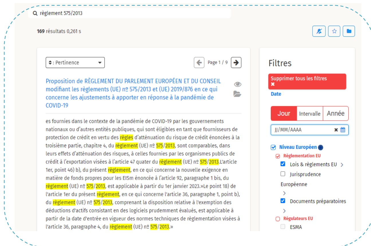
Figure 4 : recherche par facette

Puisque le serveur Legirank indexe des millions des documents, les résultats de la recherche peuvent être trop nombreux, pour cela il faudra pouvoir les filtrer.