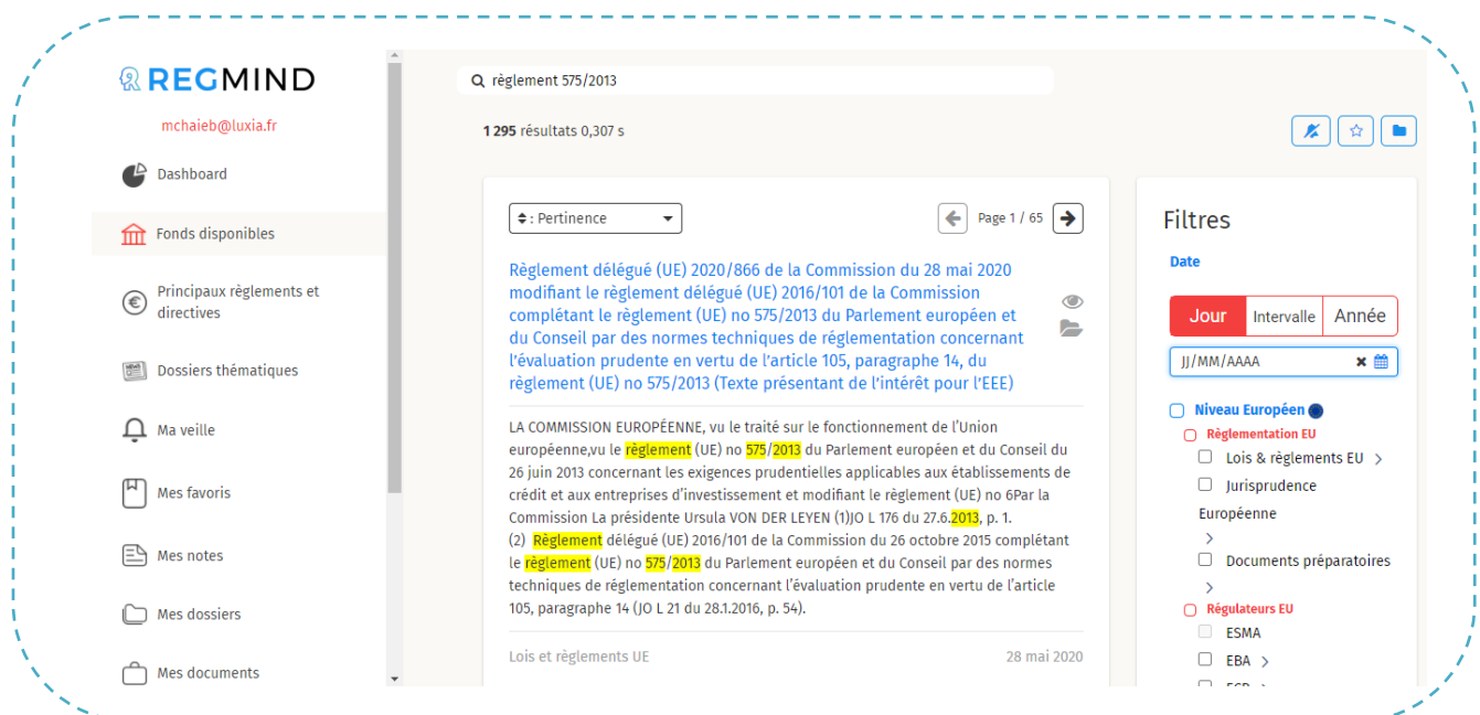
Figure 3 Résultat de recherche

Regmind offre sa boîte de recherche à son public afin de lancer ses recherches.