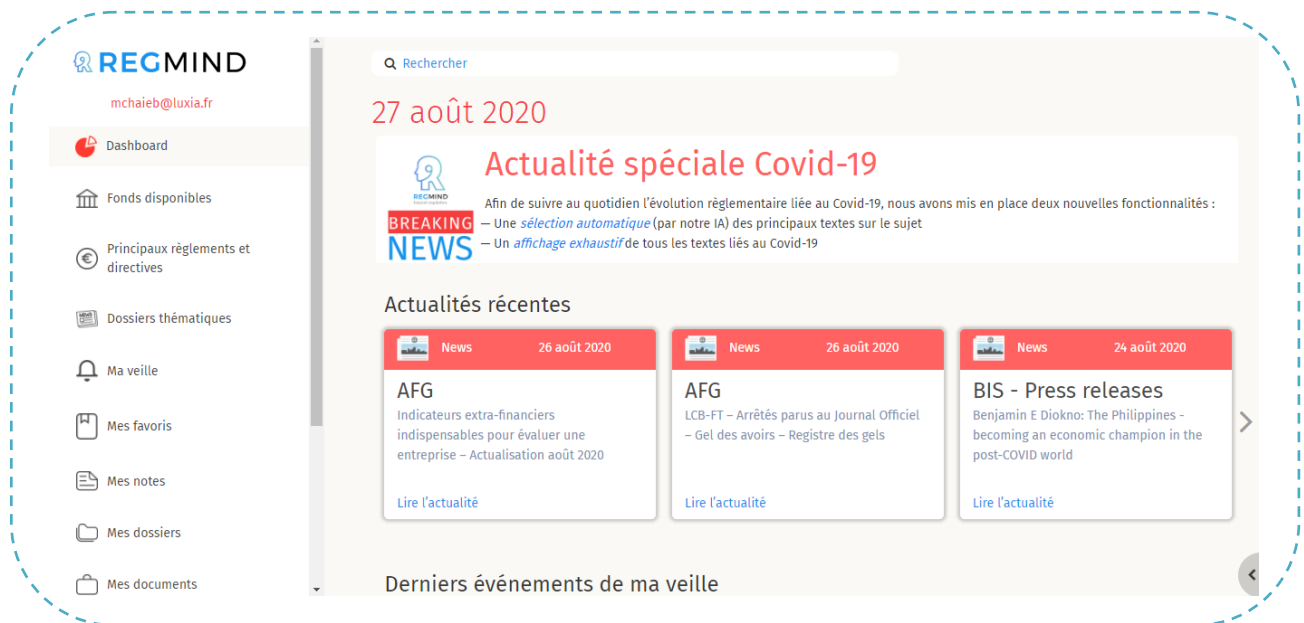
Figure 2 interface principale sur Regmind

Comme il s'agissait de reprogrammer le back-end, l'analyse du front-end doit répondre aux différents besoins du client.