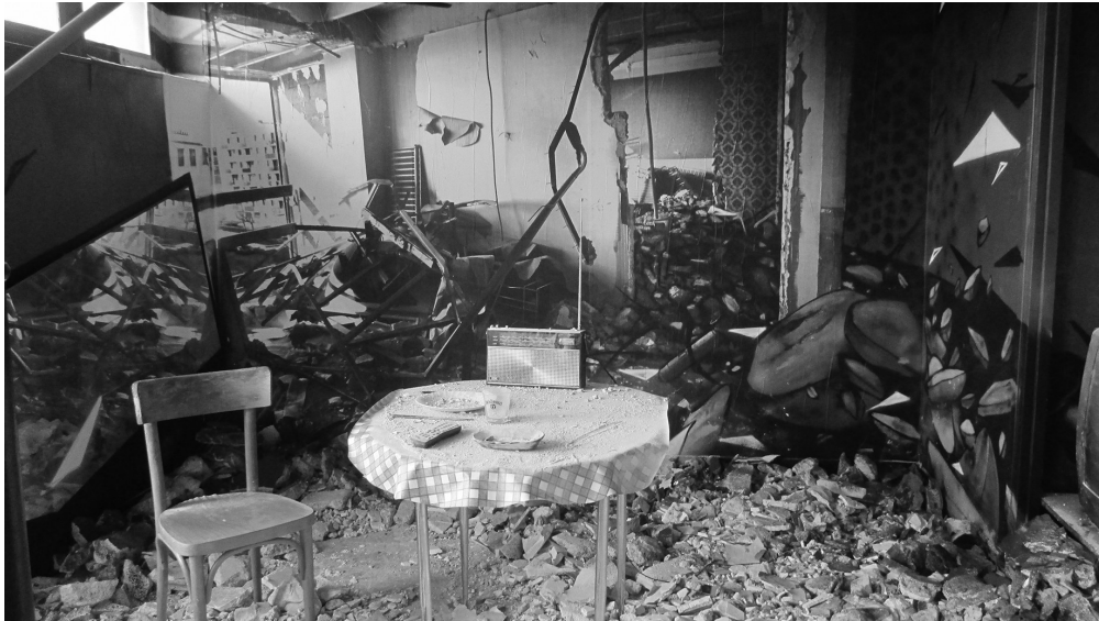
Vue de l'intervention de l'artiste Katre dans un appartement de la Tour Paris 13

l'appartement était encore meublé, il y avait aussi des tenues de travail et des photographies de la personne qui y vivait. Katre a alors réutilisé les meubles pour les intégrer à son installation.