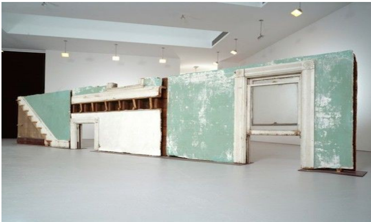
Gordon Matta-Clark, Bingo , 1974 Fragments de bâtiment: bois, métal, plâtre et verre, trois sections, dimensions 175.3 x 779.8 x 25.4 cm Vue d'exposition

Matta-Clark répète ce même dispositif pour plusieurs œuvres où il présente des traces matérielles (fragments) et immatérielles (films et photographies). Pour Bingo en 1974, il découpe en neuf parties égales la façade d'une maison située à Niagara Falls. L'œuvre porte ce titre car sa coupe lui fait penser à la grille du jeu Bingo. L'artiste rend compte de son intervention en exposant des photographies, un film et trois parties de cette façade. Avec ces fragments, on voit à la fois l'extérieur et l'intérieur de la maison.