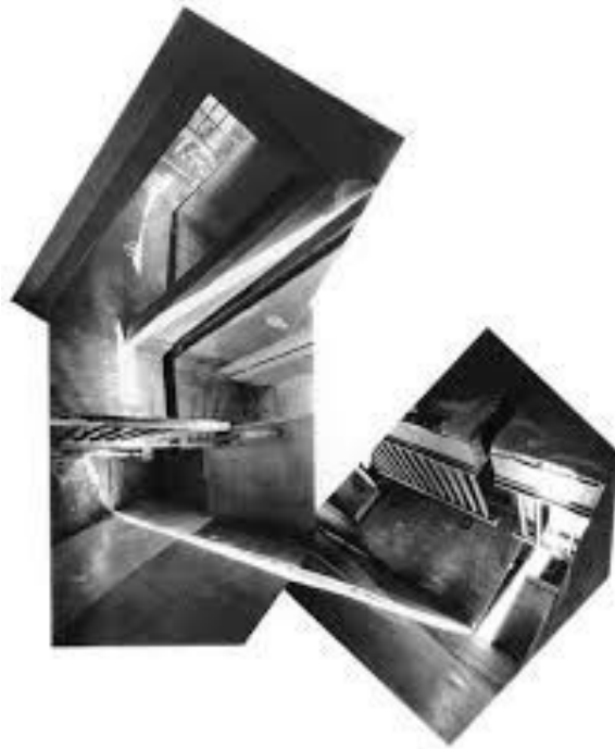
Gordon Matta-Clark, documentation sur Splitting , 1974.