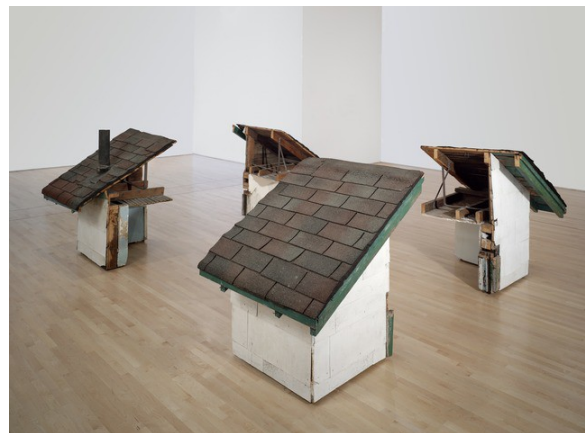
Gordon Matta-Clark, Splitting: Four Corners , 1974 Vue d'exposition, fragments de bâtiment , dimensions variables