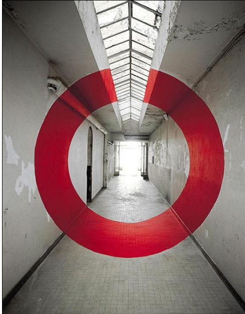
Georges Rousse, Sabourin 2 , 2009, Clermont-Ferrand Installation photographique, dimensions 160 X 125 cm

Rousse s'adapte aux contraintes inhérentes à ces espaces et travaille avec ce qui s'altère et se détruit. L'élaboration de son œuvre est influencée par l'entropie et il doit en quelque sorte restaurer des parties de l'espace en bricolant pour continuer de travailler.