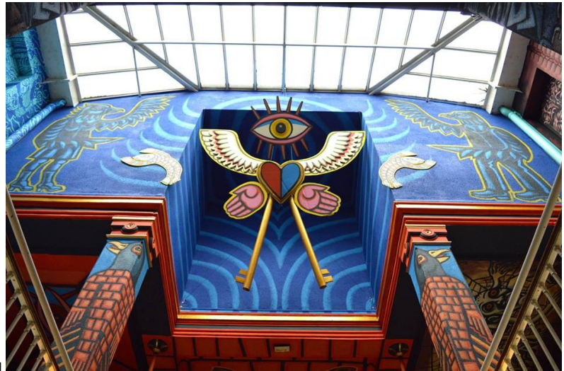
Vues de l'intervention de l'artiste David Bartex à l'étage pour l'exposition Entrez Libre , 2017