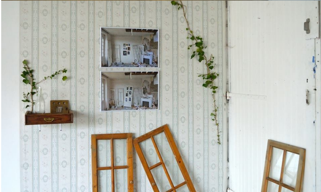
Installation au 48, Elaboratoire, Rennes, 2017 Vues de l'exposition, Ce qui reste , Galerie du 48 à l'Elaboratoire