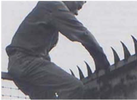
Stalker , déambulation autour de Rome, 1995

apocalyptique. C'est un territoire dangereux qui nécessite un guide pour être parcouru. Le Laboratoire Stalker a été fondé par Francesco Careri qui est aussi l'auteur du livre Walkscapes . Francesco Careri soutient dans ce livre que la marche a participé à la construction du paysage et qu'elle est liée à l'architecture. Chez Careri, la construction du paysage est symbolique. Celui-ci s'établit par l'expérience de l'espace parcouru, vécu, et sous la forme de sa transmission par des récits oraux ou écrits. L'auteur est influencé par les artistes du Land Art, qui « ont vu dans la marche une forme d'art qu'ils pouvaient utiliser pour intervenir dans la nature 20 . » Stalker reprend ce mode d'intervention pour parcourir les zones vides de la ville. Les marches sont synonymes d'aventure, car le collectif n'hésite pas à escalader les murs, enjamber des barrières pour traverser ces zones.