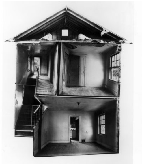
Gordon Matta-Clark, documentation sur Splitting , 1974

Photomontage, dimensions 101.5 x 76.2 cm