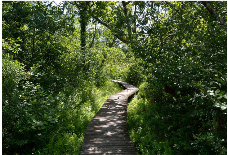
Photo extraite de la série sur les chemins

Les lieux en ruines m'ont particulièrement intéressée, car ils sont redevenus "sauvages". Dans ces endroits la végétation reprend ses droits et redonne vie à ces espaces. Ceux-ci sont comme une sorte de nouveau paysage où deux mondes opposés cohabitent. À l'intérieur de ces ruines, je photographie en série des ouvertures de portes et de fenêtres. Ces ouvertures sont des passages entre l'intérieur symbolisant l'espace de l'homme et l'extérieur symbolisant l'espace de la nature. Comme les portes et les fenêtres sont retirées ou simplement ouvertes, il n'y a plus de délimitation et la végétation pénètre à l'intérieur. En les photographiant frontalement, on peut voir ces deux mondes sur un même plan se rencontrer. Les deux séries sur ces lieux donnent à voir l'état "transitoire" de ce paysage. Étant ouverts, ils subissent constamment des modifications liées au temps et aux passages de ceux qui les visitent ou qui les habitent de manière éphémère. Je collecte également des matériaux dans ces lieux, qui avec les photographies, sont les seules traces qui restent de mes balades. Ces objets sont, en quelque sorte, des souvenirs que j'accumule tout comme les photographies. Dans ma