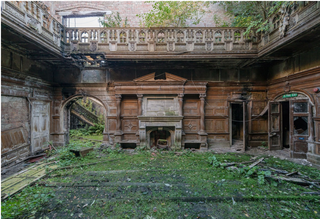
Romain Veillon, Healing Souls , 2005, Ecosse Photographie, dimensions 100 x 150 cm

sont ouverts aux intrusions naturelles. Ils passent d'un état de maîtrise et d'entretien à un état ouvert aux aléas, aux mouvements, aux fluctuations. Les intempéries font s'effondrer peu à peu la structure du bâtiment. La pluie commence par détruire les plafonds puis les sols. Les murs, les tapisseries, les moquettes moisissent. Les murs s'effritent. La végétation s'introduit à l'intérieur, la mousse pousse là où l'eau s'est infiltrée, le lierre se répand sur les façades et rentre par les ouvertures. Des arbres peuvent pousser à l'intérieur si l'endroit est abandonné depuis longtemps. L'entropie permet de rendre compte des espaces et des matériaux qui s'affaissent, qui s'usent par l'action du temps. Comment les artistes travaillent-ils avec l'entropie et montrent-ils ce processus ?