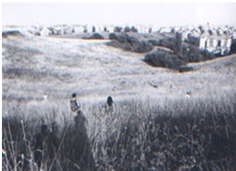
Stalker , Franchissements , 1998

Photogramme extrait de la vidéo réalisée lors de la déambulation autour de Rome en 1995.