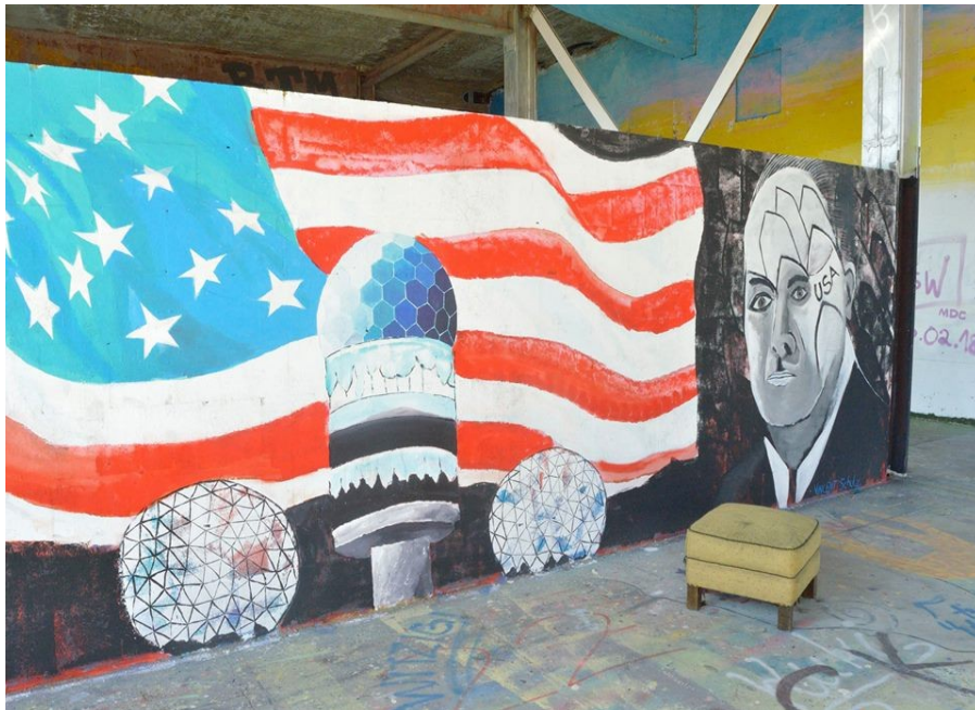
Teufelsberg, 2018, Berlin

celui d'en faire un musée de l'espionnage ou un hôtel 5 étoiles n'ont jamais abouti. En 2006, le site est classé zone naturelle et les projets de constructions sont donc annulés. L'ancienne station d'espionnage de la NSA laissée à l'abandon a été vandalisée, squattée et reconvertie en galerie d'art alternative dans les années 2000. Les squatters organisés en association lancent le projet « graffiti gallery » et invitent des graffeurs d'Europe à venir y travailler. On peut notamment y voir des graffs qui font référence à l'ancienne activité du site. L'association organise aussi des visites pour raconter l'histoire du lieu. Pour le visiter, l'entrée est payante, ce qui permet à l'association d'obtenir des fonds pour financer l'activité et maintenant le site en état. Mais depuis 2015, les propriétaires du terrain qui avaient accordé le droit d'occupation l'on retiré et imposent des restrictions à l'association. Un accord entre les deux parties du site n'a pas encore été trouvé et l'activité peut être mise en péril.