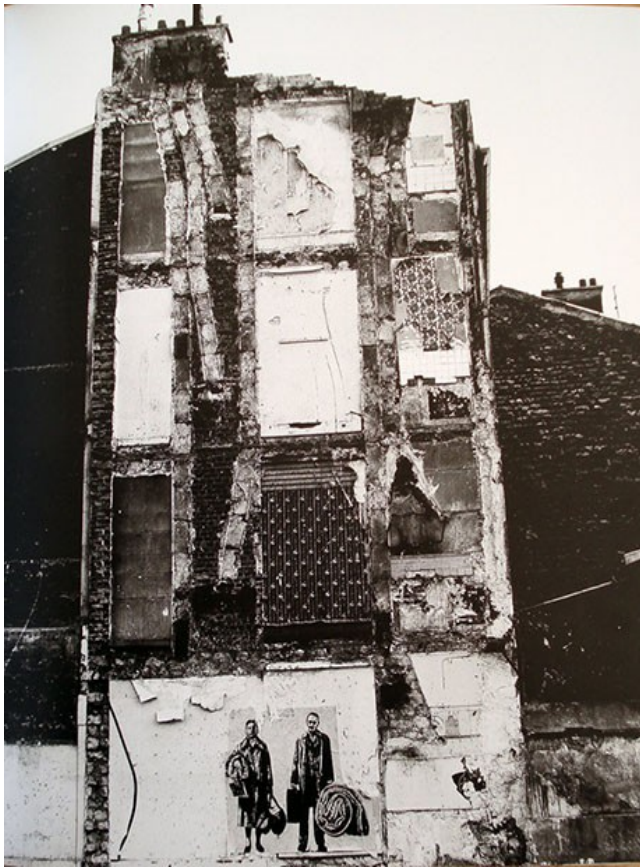
Pignon Ernest-Pignon, Les expulsés , 1978 Affiche sérigraphiée collée sur une façade, dimensions variables / échelle 1

choisit des murs qui ont la spécificité de présenter des traces de vie (tapisseries, marques de meuble, démarcations entre les appartements) des habitations qui ont été détruites. Son affiche sérigraphiée représente un couple d'un certain âge, avec leurs valises, un matelas à la main et une couette sous le bras. Les deux personnages montrent qu'ils sont expulsés du bâtiment en emportant leur affaire avec eux. Ernest Pignon-Ernest travaille à partir de cet espace, donnant à voir les restes de cet événement, afin de mettre en évidence la situation de la population ouvrière qui habitait ce quartier et qui a dû aller se_reloger en banlieue. Son travail réactive la mémoire du lieu pour sortir de l'oubli les personnes qui sont dans la précarité sociale, en représentant leurs situations et en affichant celles-ci dans la rue. Sa relation à l'espace est donc narrative, car il raconte l'histoire du lieu. L'artiste cherche à exprimer et à révéler par cette œuvre les injustices sociales qu'entraîne ce projet urbanistique.