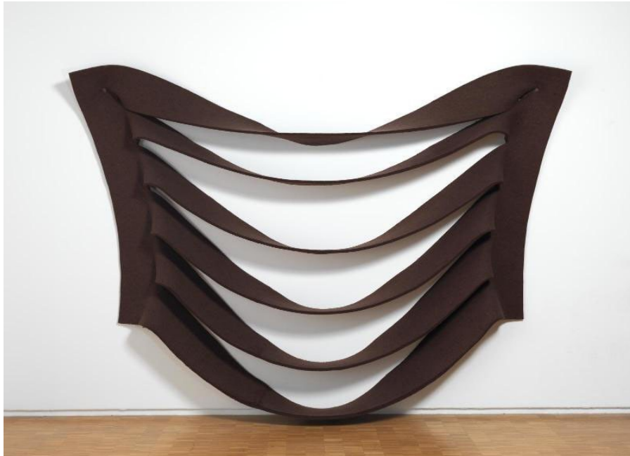
Robert Morris, Wall Hanging (série Felt Piece ) 1969-1970 Plaqué de feutre découpée, dimensions 250 x 372 x 30 cm

Comme la nature des lieux abandonnés est processuelle, y élaborer une œuvre ou l'implanter est différent que d'investir un lieu protégé comme le musée ou l'atelier. Dans les espaces traditionnels, les conditions de travail sont stables. L'artiste n'est pas dérangé par les intempéries, la saleté, la détérioration et les autres interférences propres à ces espaces. Dans les lieux à l'abandon, les conditions de travail sont différentes, plus aventureuses. Georges Rousse évoque les conditions auxquelles il a dû faire face lors de la réalisation de Sabourin 2 , dans un ancien hôpital à Clermont-Ferrand :