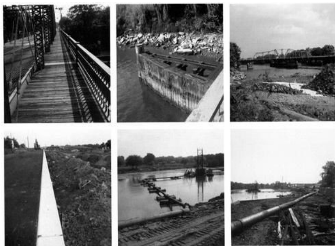
Robert Smithson, A Tour of the Monument of the Passaic, 1967 Photographie argentiques, dimension 35,5 x 35,5cm

Les zones suburbaines sont révélées comme un nouveau paysage à explorer. Le territoire que Smithson parcourt est de même nature que ceux arpentés par Stalker, ce sont des « territoires actuels 28 », des espaces qui sont apparus avec l'évolution, l'accroissement de la ville. Les observations et l'analyse de Smithson lors de son voyage se focalisent sur les « monuments » de Passaic qu'il prend en photo avec son Instantamic 400. Son voyage débute quand il monte dans le bus. Par la fenêtre, il remarque un premier « monument » qui n'est autre que le pont qui traverse la rivière de Passaic. Il descend alors du bus pour continuer son « odysée » à pied. Smithson entame alors une marche pour explorer le paysage de Passaic. En étant sur le pont, l'artiste écrit qu'il a l'impression de prendre en photo une photographie.