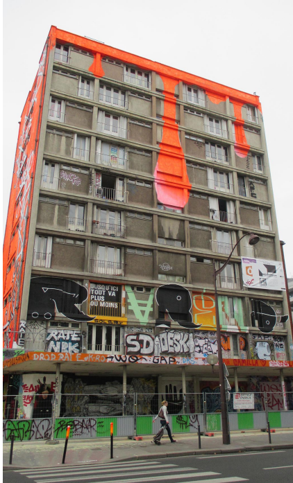
Vue extérieur de la Tour Paris 13 , 2013

permettant de déambuler dans les appartements de l'immeuble, devenu pour un mois une œuvre monumentale où coexistaient les différents univers graphiques et picturaux.