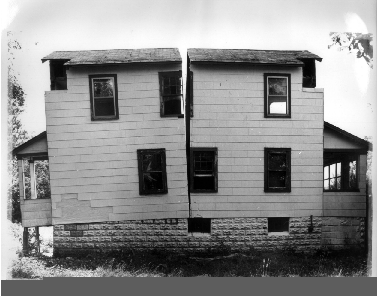
Gordon Matta-Clark, Splitting , 1974, New Jersey Épreuves argentiques, dimensions 95,2 x 150,5 cm