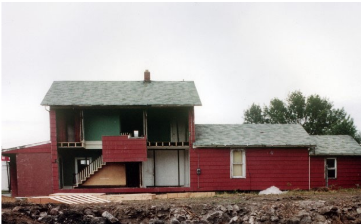
Gordon Matta-Clark, Bingo, 1974, Niagra Falls, New York Photographie argentique, dimensions variables