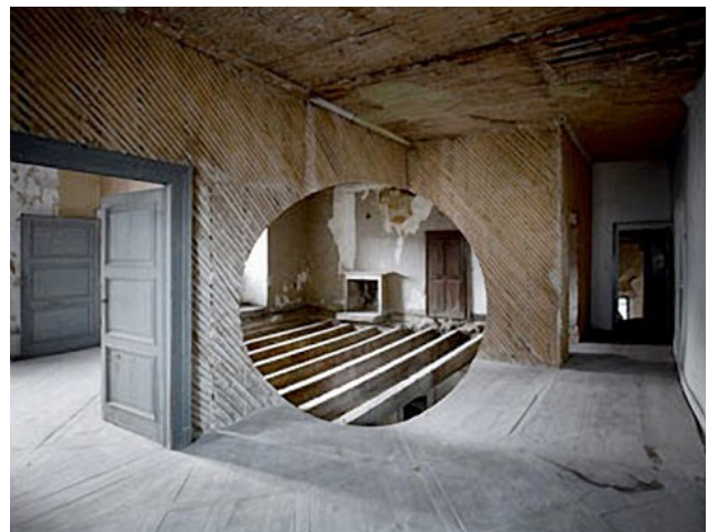
Georges Rousse, Alex , 2000 Installation photographique, dimensions 125 X 160 cm

Rousse procède aussi par soustraction, en retirant des éléments architecturaux. La forme n'est alors pas peinte, mais directement sculptée dans la « matière architecturale » pour reprendre les mots d'Églantine Belêtre. Pour Alex , réalisée en 2000, l'artiste a investi un manoir où il a enlevé le plâtre des murs, retiré des lattes du plancher, abattu des cloisons pour ouvrir l'espace vers une autre pièce. La forme du cercle apparaît donc par retrait et laisse voir la cheminée et la porte de la pièce qui se trouvait derrière celle qu'il a investie. Il retire aussi de la matière pour laisser passer la lumière comme à Chasse-sur-Rhône en 2010. Dans cette installation, Rousse découpe le sol ainsi que le plafond, laissant ainsi apparaître la structure du bâtiment et il y ajoute ensuite la matière picturale de couleur bleue.