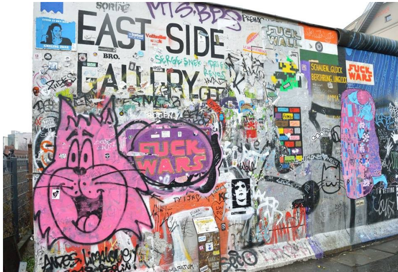
East-Side Gallery, 2018, Berlin

Cet arrondissement en ruine est devenu à la mode : « Fatalement, cela a fait réaliser rapidement aux investisseurs que laisser le quartier entre les mains de cette population « bohème » était une perte d'argent et surtout d'espace. Les rives de la Spree constituaient un terrain à bâtir... idéal ! 130 » Le projet de construction « Media Spree » de la ville menace maintenant des immeubles et l'identité du quartier. Comme Kreuzberg est un quartier « branché », les investisseurs immobiliers et la ville veulent réaménager une partie du quartier en construisant des immeubles dédiés aux technologies de la communication, plus rentables économiquement. Cependant, l'idée ne plaît pas aux habitants du quartier qui mettent en place une pétition pour organiser un référendum.