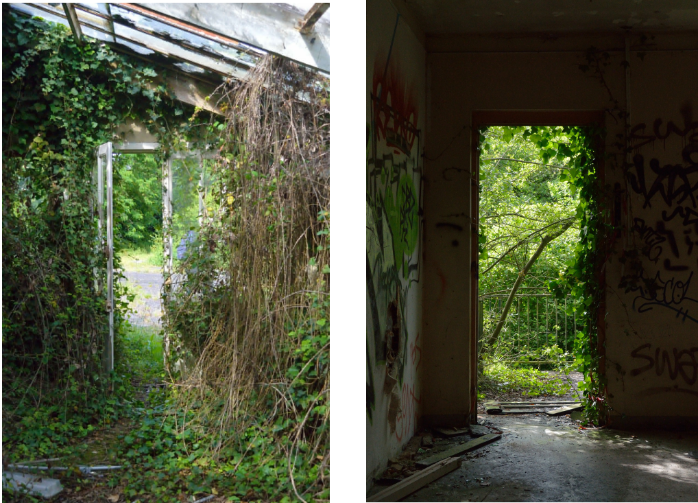
Photo extraite de la série sur les portes en cours depuis 2016

pratique, les séries sont considérées comme des matériaux, à partir desquels je retravaille pour les présenter dans une installation, constituée des des objets collectés.