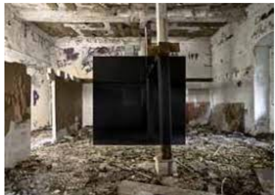
Georges Rousse, Bastia 2 , 2008, Corse Installation photographique, dimensions variables

Outre l'ajout de matière picturale, l'artiste peut parfois apporter des éléments architecturaux. Pour l'œuvre Metz réalisée en 1994, l'artiste a greffé des poutres en bois arquées pour encore plus troubler notre vision, et une cloison à gauche pour tenir la première poutre. Enfin, Rousse peut construire des structures en trois dimensions en latte de bois, comme pour Sabourin 4 , où il a investi la chaufferie d'un ancien hôpital à Clermont-Ferrand en 2009. L'artiste y a édifié une structure qui se juxtapose à l'architecture réelle en s'appuyant sur la poutre centrale. Les deux constructions sont réunies par le carré rouge peint sur le sol, le plafond et sur la structure.