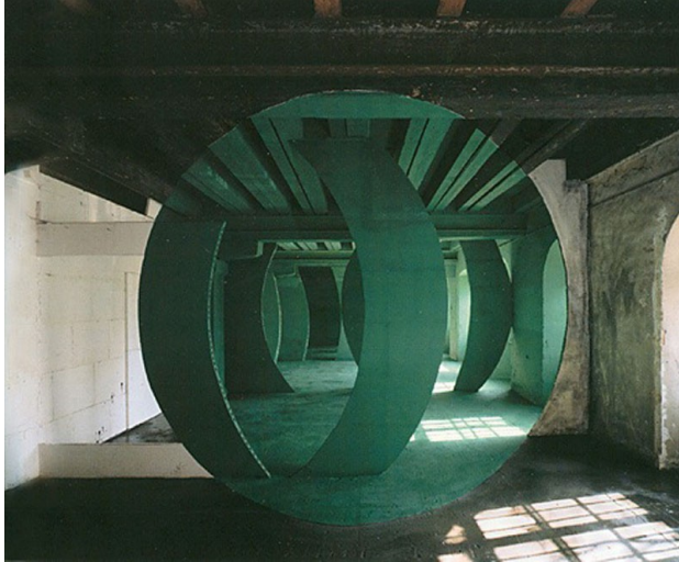
Georges Rousse, Metz , 1994 Installation photographique, dimensions 125 X 160 cm

Rousse procède aussi par soustraction, en retirant des éléments architecturaux. La forme n'est alors pas peinte, mais directement sculptée dans la « matière architecturale » pour reprendre les mots d'Églantine Belêtre. Pour Alex , réalisée en 2000, l'artiste a investi un manoir où il a enlevé le plâtre des murs, retiré des lattes du plancher, abattu des cloisons pour ouvrir l'espace vers une autre pièce. La forme du cercle apparaît donc par retrait et laisse voir la cheminée et la porte de la pièce qui se trouvait derrière celle qu'il a investie. Il retire aussi de la matière pour laisser passer la lumière comme à Chasse-sur-Rhône en 2010. Dans cette installation, Rousse découpe le sol ainsi que le plafond, laissant ainsi apparaître la structure du bâtiment et il y ajoute ensuite la matière picturale de couleur bleue.