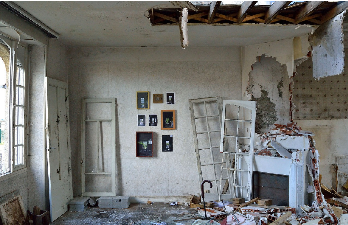
Installation rue Capitaine Palicot, Rennes, 2017 Installation in situ dans le salon d'une maison abandonné.