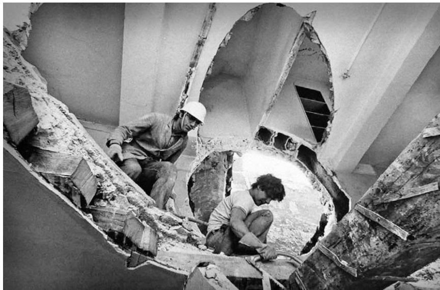
Gordon Matta-Clark, Conical Intersect, 1975, Paris Film 16 mm en couleur, 18 : 40 min

En 1975, Matta-Clark est invité à la Biennale de Paris. Il intervient dans deux immeubles, situés au 27 et 29 de la rue Beaubourg, voués à la démolition dans le cadre du projet urbain qui vise à moderniser le quartier des Halles et à construire le centre Georges Pompidou. Il réalise Conical Intersect , une coupe gigantesque en forme de cône. Ces demeures ont la particularité d'être faites en béton et en pierre, rendant la tâche difficile pour l'artiste. Jusqu'ici, il ne s'était attaqué qu'à des bâtiments où les matériaux, comme le bois et le plâtre, n'étaient pas difficiles à découper. Pour produire, la coupe gigantesque qui traverse de part en part la bâtisse investie, il commence par entailler la façade nord d'une des bâtisses, faisant démarrer le cône par un trou dans le mur en forme de cercle. Le cône continue en forme de tunnel à travers tout l'immeuble et sa pointe aboutit sur le toit de l'autre maison. L'œuvre est réalisée en référence à celle d'Antony McCall Line describing cone conçue en 1973. C'est une installation avec un projecteur diffusant une ligne de lumière : les spectateurs doivent se déplacer dans l'espace d'exposition pour voir la forme du cône. L'ouverture en forme de cône dans l'espace architectural fonctionne de manière analogue, faisant entrer la lumière naturelle à l'intérieur du bâtiment.