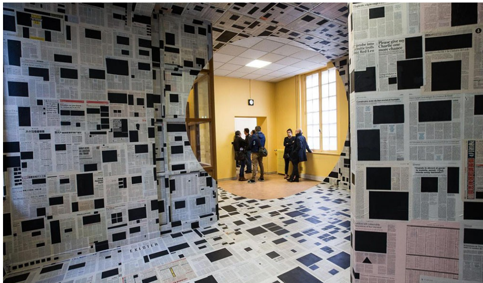
Vue de l'exposition à l'ancienne Banque de France à Lens

Lors de Détournement de fonds en 2017, l'artiste investit l'ancienne Banque de France à Lens ouverte au public pour l'occasion. L'exposition se déroule dans trois pièces. Dans la première, il tapisse entièrement l'espace avec du papier journal, hormis une partie qui, par réserve, fait apparaître un cercle. Les spectateurs le traversent pour accéder à la deuxième pièce où Rousse a réalisé une autre anamorphose peinte en rouge. Enfin, dans la troisième pièce, sont exposées quelques-unes de ses photographies. En parcourant les deux espaces précédents, les spectateurs ont une vue directe sur son travail en volume et peuvent ainsi analyser avec une meilleure appréhension ses photographies.