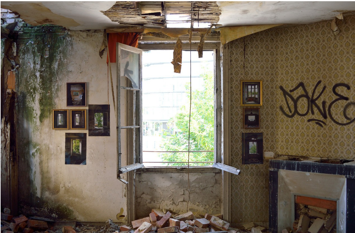
Installation Mail François Mitterrand, Rennes, 2017 Installation in situ dans la chambre d'une maison abandonnée.