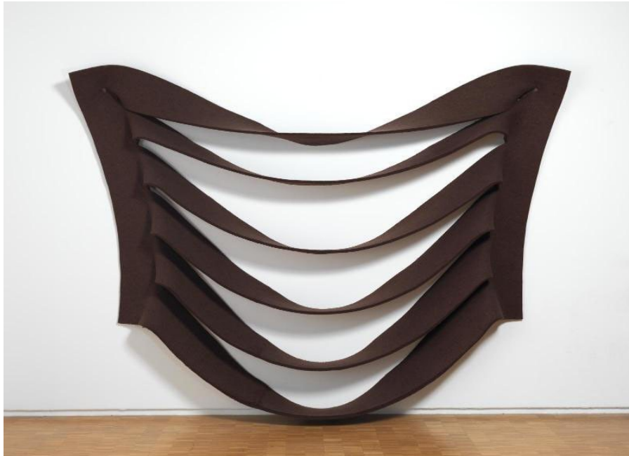
Robert Morris, Wall Hanging (série Felt Piece ) 1969-1970 Plaques de feutre découpée, dimensions 250 x 372 x 30 cm

Comme la nature des lieux abandonnés est processuelle, y élaborer une œuvre ou l'implanter est différent que d'investir un lieu protégé comme le musée ou l'atelier. Dans les espaces traditionnels, les conditions de travail sont stables. L'artiste n'est pas dérangé par les intempéries, la saleté, la détérioration et les autres interférences propres à ces espaces. Dans les lieux à l'abandon, les conditions de travail sont différentes, plus aventureuses. Georges Rousse évoque les conditions auxquelles il a dû faire face lors de la réalisation de Sabourin 2 , dans un ancien hôpital à Clermont-Ferrand :