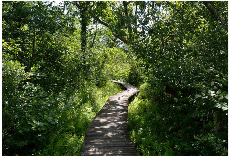
Photo extraite de la série sur les chemins

Les lieux en ruines m'ont particulièrement intéressée, car ils sont redevenus "sauvages". Dans ces endroits la végétation reprend ses droits et redonne vie à ces espaces. Ceux-ci sont comme une sorte de nouveau paysage où deux mondes opposés cohabitent. À l'intérieur de ces ruines, je photographie en série des ouvertures de portes et de fenêtres. Ces ouvertures sont des passages entre l'intérieur symbolisant l'espace de l'homme et l'extérieur symbolisant l'espace de la nature. Comme les portes et les fenêtres sont retirées ou simplement ouvertes, il n'y a plus de délimitation et la végétation pénètre à l'intérieur. En les photographiant frontalement, on peut voir ces deux mondes sur un même plan se rencontrer. Les deux séries sur ces lieux donnent à voir l'état "transitoire" de ce paysage. Étant ouverts, ils subissent constamment des modifications liées au temps et aux passages de ceux qui les visitent ou qui les habitent de manière éphémère. Je collecte également des matériaux dans ces lieux, qui avec les photographies, sont les seules traces qui restent de mes balades. Ces objets sont, en quelque sorte, des souvenirs que j'accumule tout comme les photographies. Dans ma