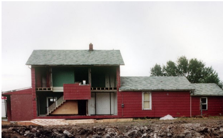
Gordon Matta-Clark, Bingo , 1974 , Niagra Falls, New York Photographie argentique, dimensions variables, Courtesy de l'artiste et David Zwirner Gallery