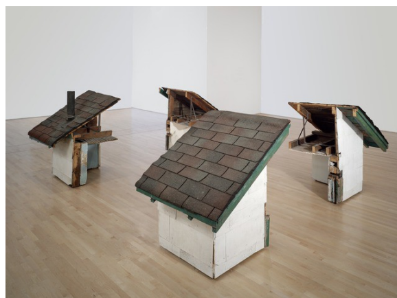
Gordon Matta-Clark, Splitting: Four Corners , 1974 Vue d'exposition, fragments de bâtiment , dimensions variables