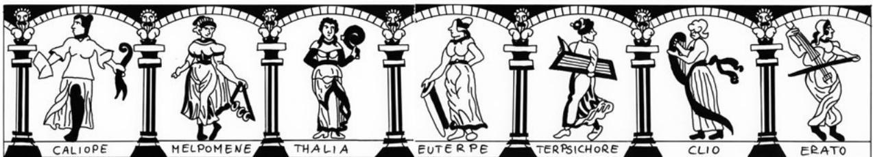
Figure 4 : Relevé graphique de la frise des muses par Nadine Cavélius.

Cette cruche de type balustre coiffée d'un couvercle en étain est remarquable par l'iconographie des muses sur sa panse [Fig. 4] 14 . Par manque de place peut-être, seules sept des neuf muses apparaissent sur la frise, séparées par des caryatides et installées sous des arcades. Chacune des muses est laissée en blanc, de même que l'architecture et les moulures encadrant la frise, sur un fond bleu. Une bande blanche sous les figures englobe la panse et renseigne le prénom des muses, déesses protectrices des arts, filles de Zeus et de Mnémosyne dans la Théogonie d'Hésiode : Melpomène, qui préside à la tragédie, Thalie, associée à la comédie, Euterpe, déesse de la musique, Terpsichore, muse de la danse, Clyto, déesse de l'Histoire, Polymnie, parrainant la rhétorique, et Calliope, mère d'Orphée et épouse d'Apollon, patronne de la poésie épique. Il s'agit essentiellement de muses musiciennes ; elles sont d'ailleurs d'abord caractérisées par leur voix dans la mythologie. Melpomène joue ici du violon, Polymnie de la lyre. Les sept femmes sont vêtues de drapés antiques. L'épaule et le bas de la panse sont décorés de languettes bleues sur fond blanc. Une frise d'entrelacs et de rinceaux pare le col. Le pied de la cruche est mouluré.