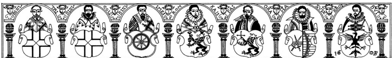
Figure 5 : Relevé graphique de la frise des princes électeurs par Michel Kohnemann. http://www.toepfermuseum.org , Bauchfries 057.

Cette cruche de type balustre est surmontée d'un couvercle en étain. Le col est paré d'une frise faisant alterner mascarons, rinceaux et cœurs. Des cordons délimitent le col, l'épaule, la frise de la panse, le bas de la panse et le pied mouluré. L'épaule est ornée de pétales bleus surmontés de losanges emboîtés, sur fond de croisillons excisés blancs. La célèbre frise des princes électeurs est au centre de la panse [Fig. 5]. Sept personnages munis de leur blason sont installés sous des arcades ponctuées de têtes de satyres. Ce sont les six princes-électeurs et l'empereur du Saint Empire romain-germanique. L'empereur est au centre de la frise, arborant un manteau et une fraise, ses armoiries sont celles du roi de Bohême, soit un lion couronné, en marche, tenant dans ses pattes-avant un calice. À sa gauche, les archevêques de Trèves et de Cologne, aux armes serties de larges croix sur toute leur surface, et de Mayence, dont le blason représente une roue. À sa droite, le comte palatin du Rhin, reconnaissable à ses armoiries, un lion en marche tenant l'orbe impérial ou globe crucigère ; le duc de Saxe, à l'écu divisé verticalement en deux coupé de deux épées croisées et avec une couronne sur fond burelé ; et enfin le margrave de Brandebourg, dont l'emblème est celui d'un aigle aux ailes déployées.