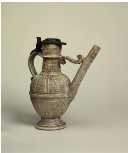
Figure 1 : Aiguière, Siegburg, 1575-1600, 24,5cm, Paris, Musée du Petit Palais, ODUT1170.