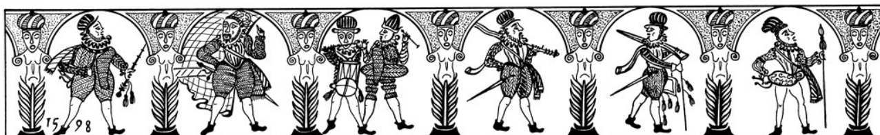
Figure 7 : Relevé graphique de la frise des lansquenets par Michel Kohnemann.

Parmi les grès rhénans du Musée Vivenel, une seule pinte ( Humpen ) permet d'observer la variété des supports de création des potiers du Westerwald. Elle est décorée en deux registres représentant une frise de lansquenets disposés sous des arcades soutenues par des caryatides à turban et des palmes dans la partie supérieure [Fig. 7 16 ], et un motif d'arbres placés alternativement à l'endroit et à l'envers dans la partie inférieure. Les caryatides enturbannées peuvent renvoyer à Ces mœurs et fachons de faire des Turcz , soit sept dessins du peintre et graveur flamand Pierre Coeck (1502-1550) rendant compte des étapes du voyage de l'artiste vers Constantinople dès 1533 17 . Chaque registre est encadré par des cordons. Ternie et corrodée, ce qui affecte la netteté des couleurs, cette pinte bleue et blanche reprend un modèle assez répandu pour la frise de soldats, inspiré des nombreuses gravures des petits maîtres allemands, qui met en scène les figures du fantassin, du porte-étendard, du joueur de fifre et du joueur de tambour.