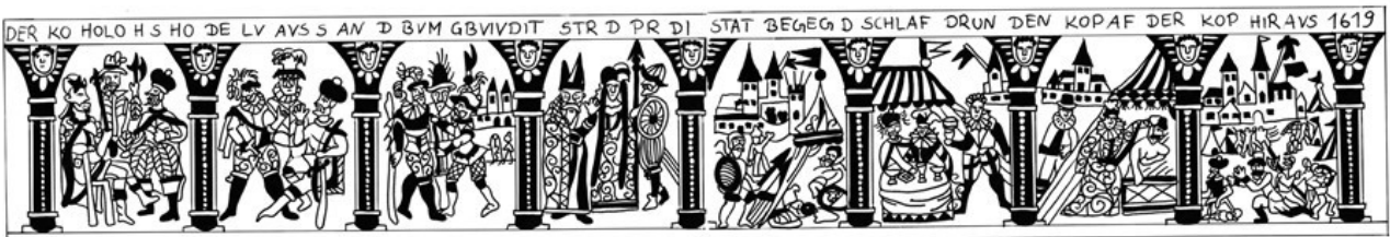
Figure 6 : Relevé de la frise racontant l'histoire de Judith et Holopherne par Nadine Cavelius.

Cette canette dotée d'un couvercle en étain se caractérise par deux registres principaux dont une frise de l'épisode biblique de Judith et Holopherne dans la partie supérieure et un décor régulier de cercles concentriques blancs sur fond bleu dans la partie inférieure, qui a certainement été restaurée étant donné les délimitations et les collages visibles. Ces deux morceaux sont structurés par des moulures blanches et de cordons. Sous le col, il s'agit d'une frise de cercles concentriques, et, enserrant le second registre, d'un ensemble de fleurs contenues dans des courbes entrelacées. À l'avant de la canette, un personnage féminin vêtu d'une longue robe, d'un voile et tenant un livre dans ses mains contre sa poitrine s'élanche sur la partie décorative. Ce sont ainsi les huit scènes de l'épisode de Judith et Holopherne qui sont centrales par leur caractère narratif [Fig. 6].