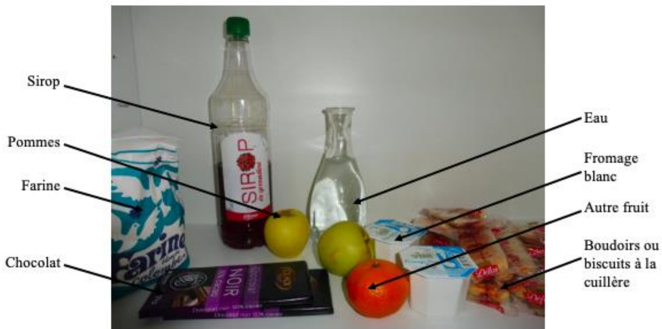
Placard du bas