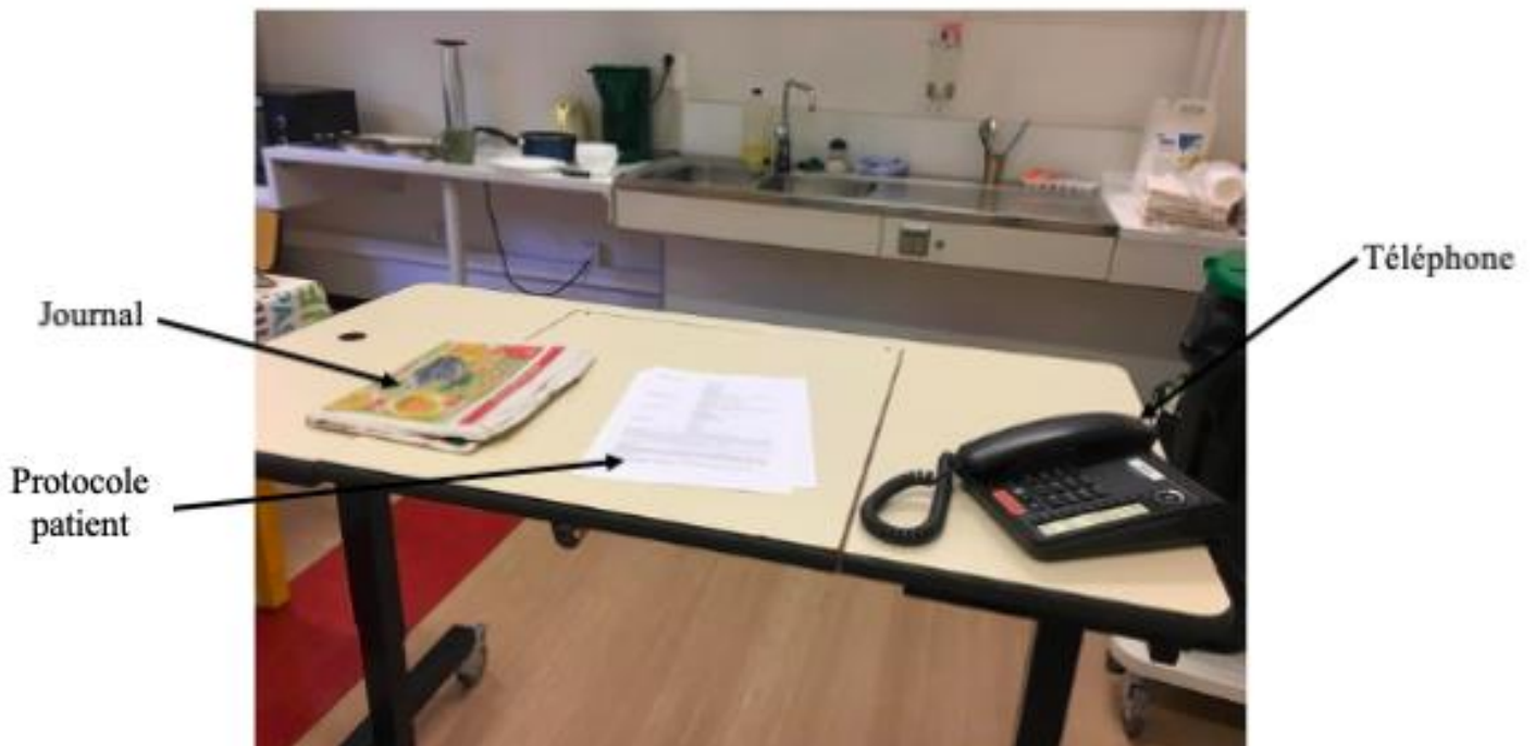
Disposition de la table