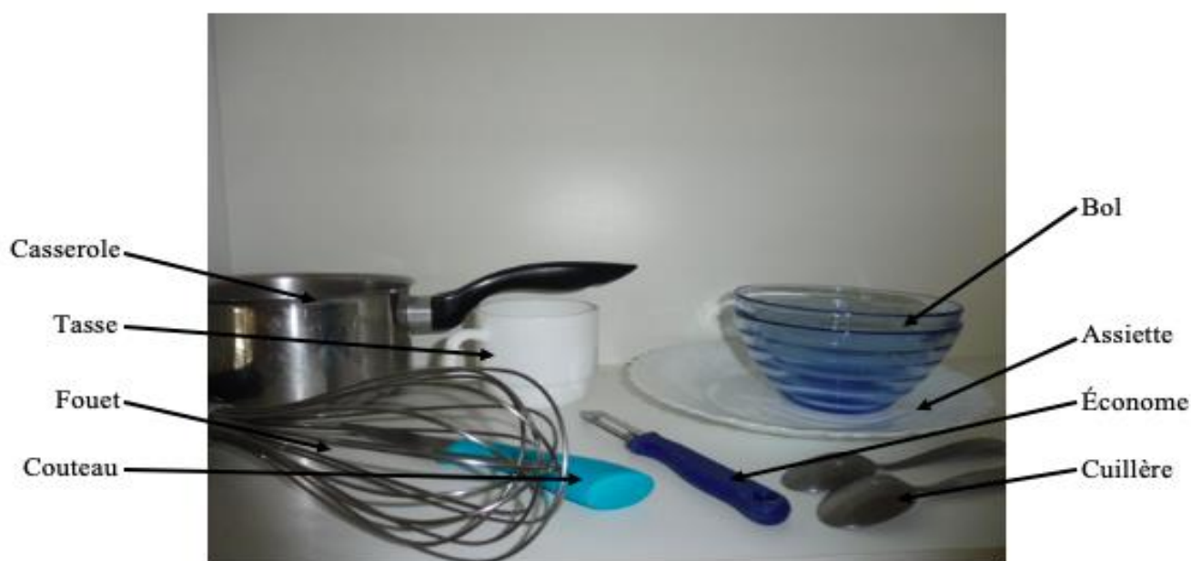
Disposition des ustensiles