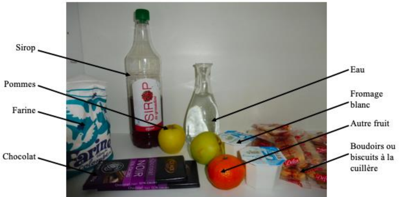
Disposition des ingrédients