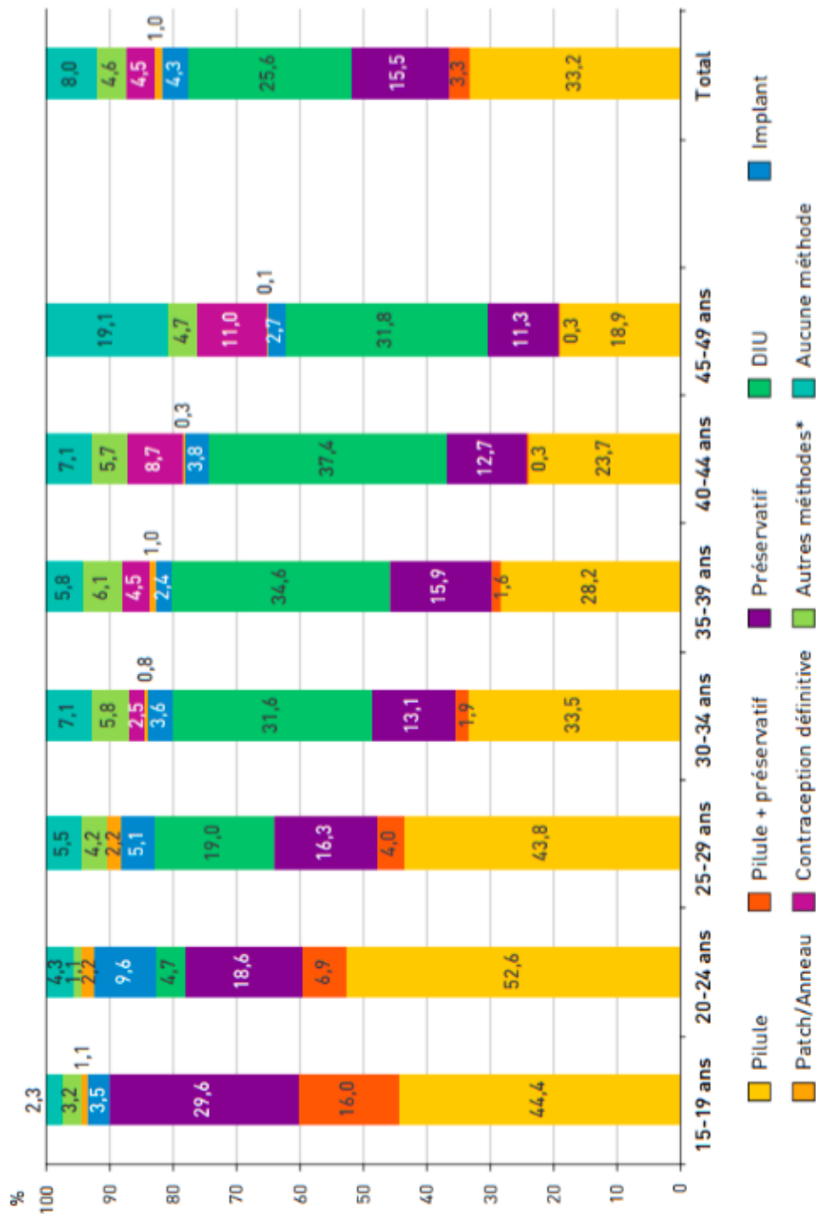
Figure : Méthodes de contraception utilisées en France en 2016 par les femmes concernées par la contraception selon leur âge

Champ : femmes de 15-49 ans résidant en France métropolitaine, non enceintes, non stériles, ayant eu une relation sexuelle avec un homme au cours des douze derniers mois et ne souhaitant pas avoir d'enfant. * Cette catégorie comprend le diaphragme, la cape et les méthodes dites traditionnelles telles que la symptothermie, la méthode des températures et le retrait.