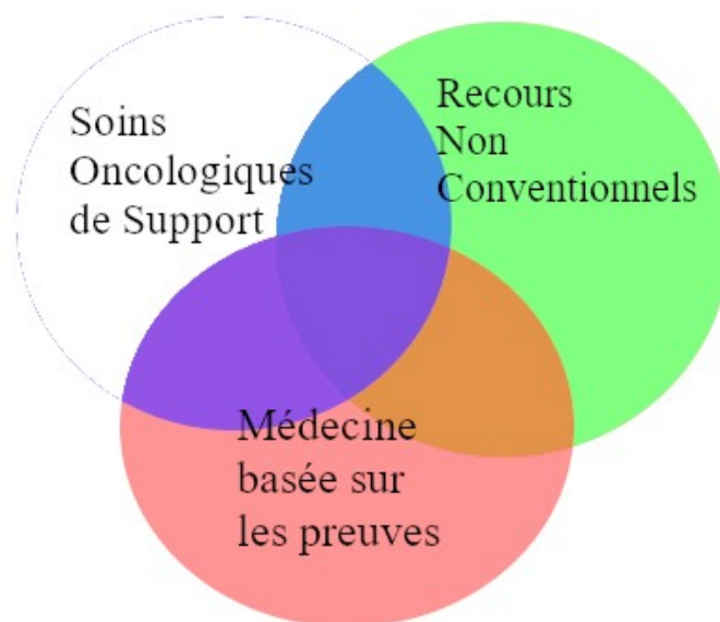
Figure 1: Représentation schématique du domaine des SOS (Lambert, 2020)

refusent de se plier à l'exigence de preuves, que ce soit par principe (méthodes basées sur la croyance comme la prière) ou par peur (charlatanismes, dérives sectaires).