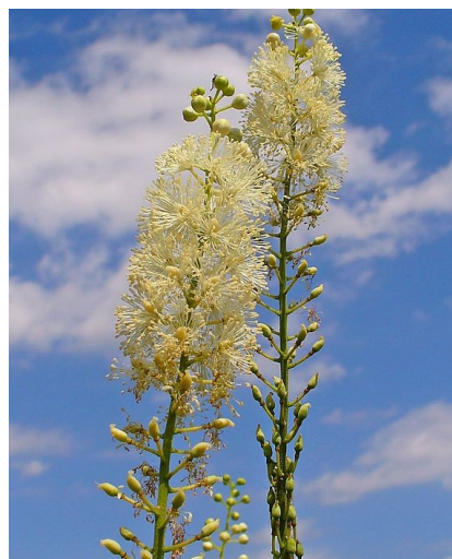
Illustration 2: Fleur d' Actea racemosa en Allemagne, par H. Zell (2009)

Les preuves sur l'utilisation d' A. racemosa montrent une inefficacité sur les bouffées de chaleur (II) et ne permettent pas de conclure sur les autres symptômes liés à la ménopause (IV). Il ne convient donc pas de la conseiller.