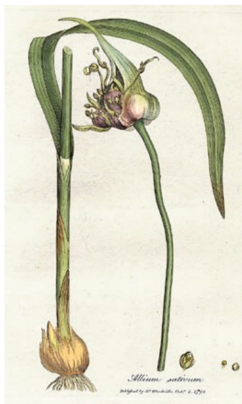
Illustration 3: Allium sativum dans William Woodville: « Medical botany », Londres, James Phillips, 1793, Vol. 3

L'ail n'a pas de réelle indication en SOS mais sa réputation comme prévenant le cancer et ses capacités antioxydantes en font une plante couramment utilisée. Il faudra donc faire attention aux interactions chez les patients souhaitant continuer leur traitement à base d'ail et préférer l'extrait d'ail vieilli, dépourvu d'alliicine.