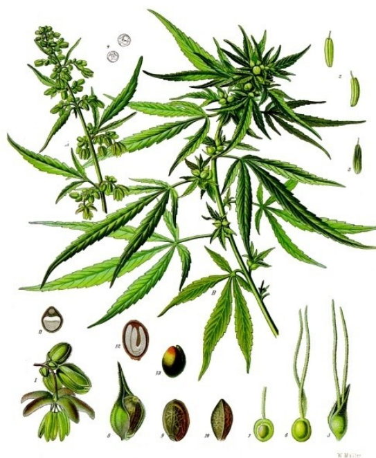
Illustration 6: Cannabis sativa par F. Köhler dans « Köhler's Medizinal-Pflanzen » (1897)

Le cannabis est à déconseiller dans la cachexie-anorexie liée au cancer (III), il ne convient pas de le conseiller dans les nausées et vomissements chimio-induits (III) mais il peut être utilisé en dernière ligne dans les douleurs neuropathiques liées au cancer (II), sous réserve d'études plus poussées sur les dosages optimaux.