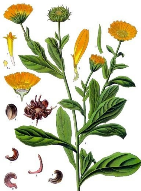
Illustration 5: Calendula officinalis par F. Köhler dans « Köhler's Medizinal-Pflanzen » (1897)

Les preuves en faveur de l'utilisation de C. officinalis dans les mucites sont faibles (IV) et il ne convient pas d'en conseiller l'utilisation. Dans le cadre des radiodermites, les preuves sont contradictoires mais permettent d'envisager son utilisation (III) grâce à un risque faible et à une non-infériorité envers les traitements habituellement utilisés.