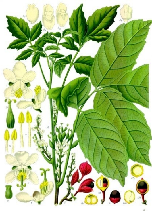
Illustration 11: Paullinia cupana par F. Köhler dans « Köhler's Medizinal-Pflanzen » (1897)

Le guarana doit être déconseillé dans la fatigue liée au cancer en cas de radiothérapie (III) et ne doit pas être conseillé dans la fatigue liée au cancer en cas de chimiothérapie (IV).