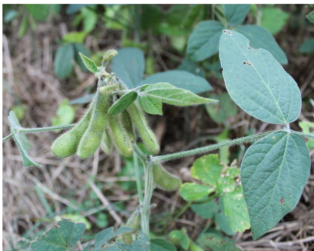
Illustration 8: Glycine max , Pennsylvanie (États-Unis) par PookieFugglestein (2013)

G. max est une plante herbacée annuelle de la famille des Fabaceae d'une hauteur de 30 à 130 cm. La plante est entièrement recouverte de poils fins, les feuilles sont trifoliées, les fleurs sont très petites, blanches à pourpres, et poussent en grappes à l'aisselle des feuilles. Les fruits sont des gousses contenant 2 à 4 graines (334).