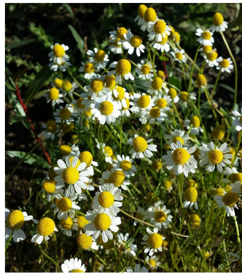
Illustration 9: Matricaria recutita à Michelstetten (Autriche), par Stefan Lefnaer (2017)

Les preuves en faveur de l'utilisation d'extraits de matricaire dans les mucites et dans les radiodermites sont faibles (IV) et ne permettent pas de conseiller son utilisation. Néanmoins le profil de tolérance est bon et la non-infériorité face à la trolamine dans les radiodermites ne justifie pas de la déconseiller non plus.