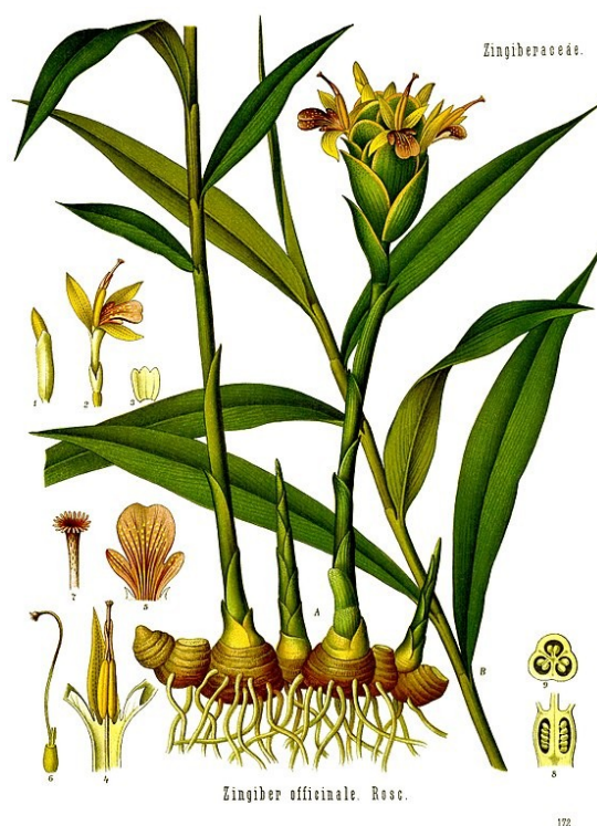
Illustration 14: Zingiber officinale par F. Köhler dans « Köhler's Medizinal-Pflanzen » (1897)

Les données sur l'utilité du gingembre ne permettent pas de déterminer si l'effet est visible cliniquement dans le cadre d'un traitement antiémétique bien conduit (III), cependant il semble bien toléré et n'a pas à être déconseillé.