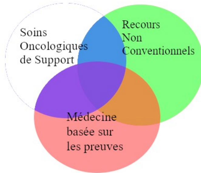
Figure 1: Représentation schématique du domaine des SOS (Lambert, 2020)

refusent de se plier à l'exigence de preuves, que ce soit par principe (méthodes basées sur la croyance comme la prière) ou par peur (charlatanismes, dérives sectaires).