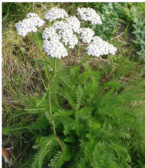
Illustration 1: Achillea millefolium à Haßloch (Allemagne), par G. Slickers (2004)

Les preuves en faveur de l'utilisation de bain de bouche d' A. millefolium dans les mucites sont faibles (IV), le manque de standardisation de l'extrait et de preuves ne permet pas de recommander son utilisation.