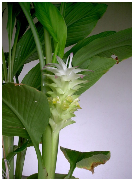
Illustration 7: Curcuma longa en fleur, île de la Réunion, auteur inconnu (2006)

Le curcuma par voie orale en prévention des radiodermites est à déconseiller (III) à cause de son manque d'efficacité et des interactions possibles. Le curcuma en voie locale dans le traitement des radiodermites ne peut être conseillé en raison d'un niveau de preuves faible (IV), tout comme pour le traitement des mucites (IV)