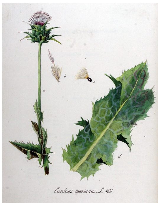
Illustration 12: Silybum marianum par Jan Kops dans « Flora Batava of Afbeelding en Beschrijving van Nederlandsche Gewassen », XI. Deel. (1853)

Les données sont trop faibles pour conseiller le chardon marie par voie orale en prévention des mucites (IV), il en est de même pour une utilisation topique dans le syndrome main-pied (IV)