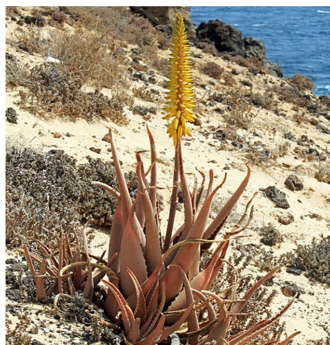
Illustration 4: Aloe vera sur l'île de Lanzarote (Espagne), par H. Zell (2012)

Les preuves dans l'indication des SOS ne sont pas en faveur de l'utilisation du gel d' A. vera dans les mucites (III) ou dans les dermatites radioinduites (II) à cause des preuves en faveur d'une inefficacité et du risque allergique.