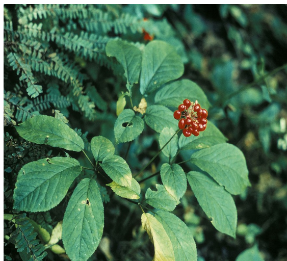
Illustration 10: Panax quinquefolius par U.S. Fish and Wildlife Service Division of Public Affairs (2008)

On utilise la racine séchée, parfois étuvée (« ginseng rouge »). Elle contient de très nombreux composés dont des glycopeptides et une huile essentielle, mais surtout de nombreux saponosides appelés ginsénosides. Certains ginsénosides ne sont pas communs aux deux espèces comme le quinquenoside de P. quinquefolius mais même dans une seule espèce la variété et les taux sont très variables entre deux provenances (340).