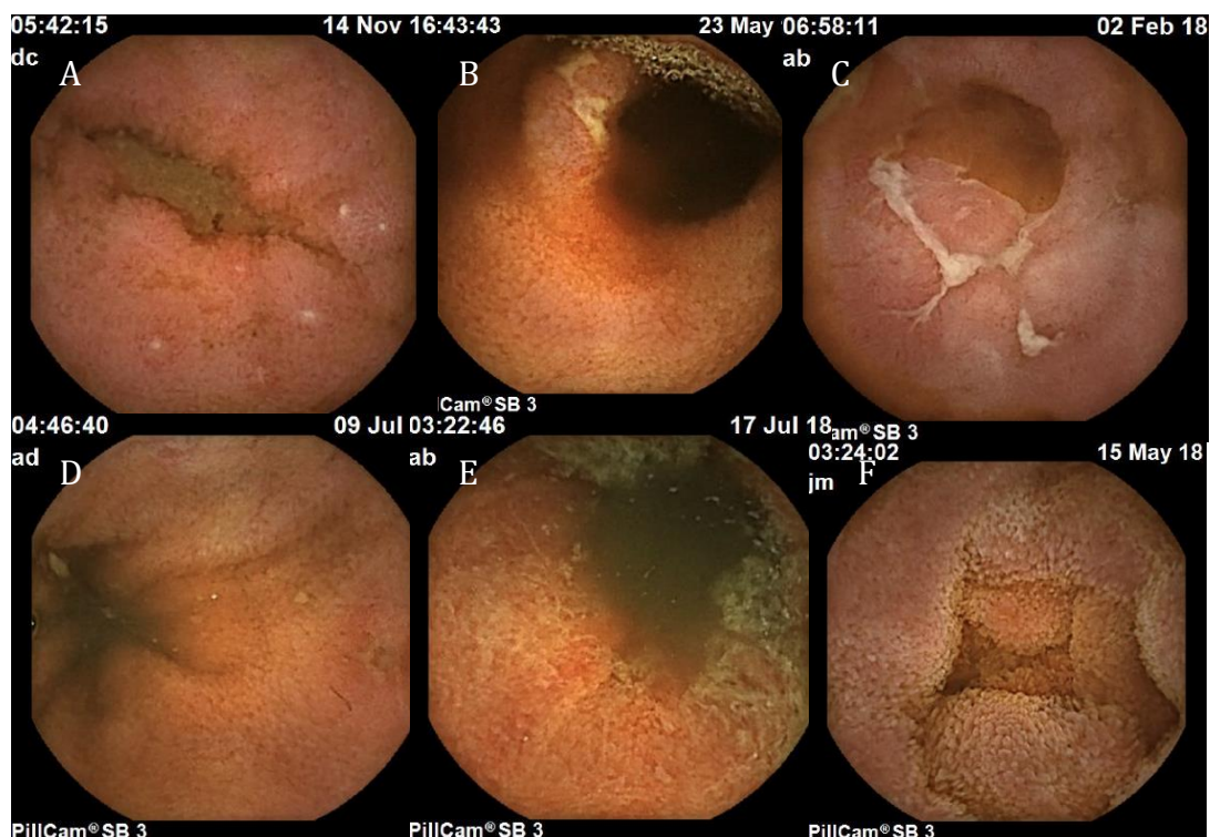
Figure 2. Lésions élémentaires. A, B, C : ulcérations ; D : érosion ; E : érythème ; F : œdème

Dans 86,5 % des cas (n = 90), la réalisation de la VCE n'avait aucun impact sur la prise en charge ultérieure.