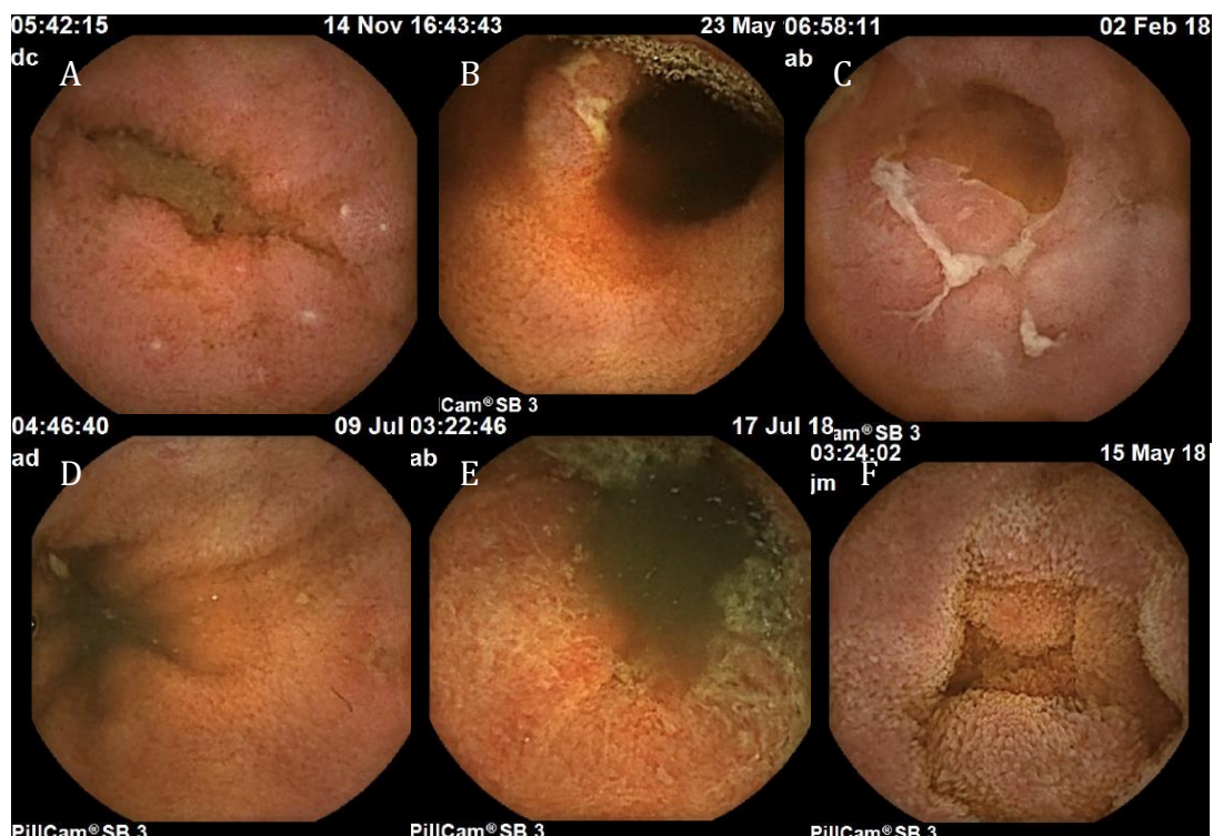
Figure 2. Lésions élémentaires. A, B, C : ulcérations ; D : érosion ; E : érythème ; F : œdème

Dans 86,5 % des cas (n = 90), la réalisation de la VCE n'avait aucun impact sur la prise en charge ultérieure.