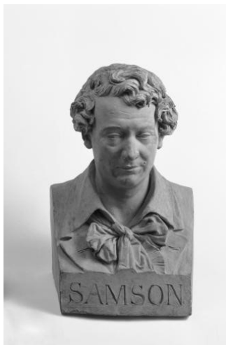
Buste de Joseph Samson