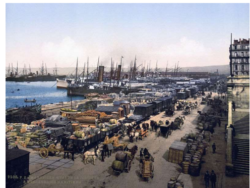
Marseille Quai de la Joliette fin XIX e