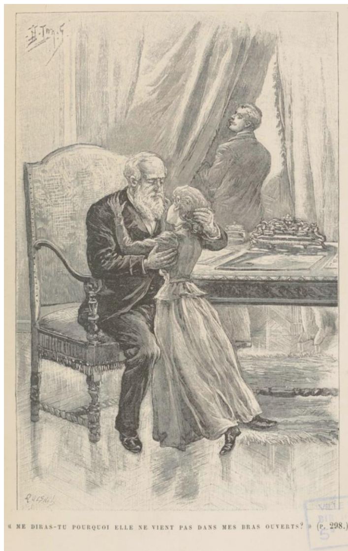
Illustration de Lanos