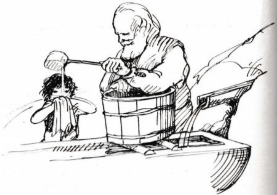
Illustration de Tomi Ungerer

surtout Colombine et Oursette. Heidi sauta de son lit et, en quelques secondes, elle eut enfilé les vêtements qu'elle por-