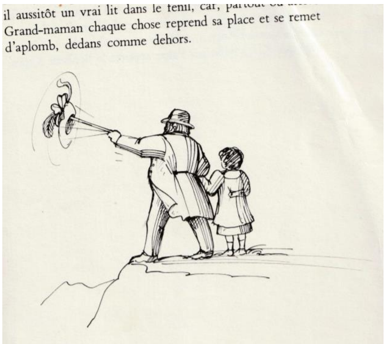
Illustration de Tomi Ungerer