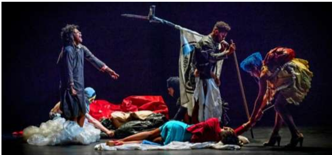
Image 29. Fúria [Les cadavres et les sacs de charbon].