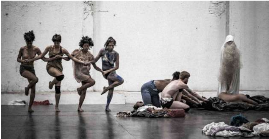
Image 14. Fúria [La sainte blanche et Le Lac des cygnes].