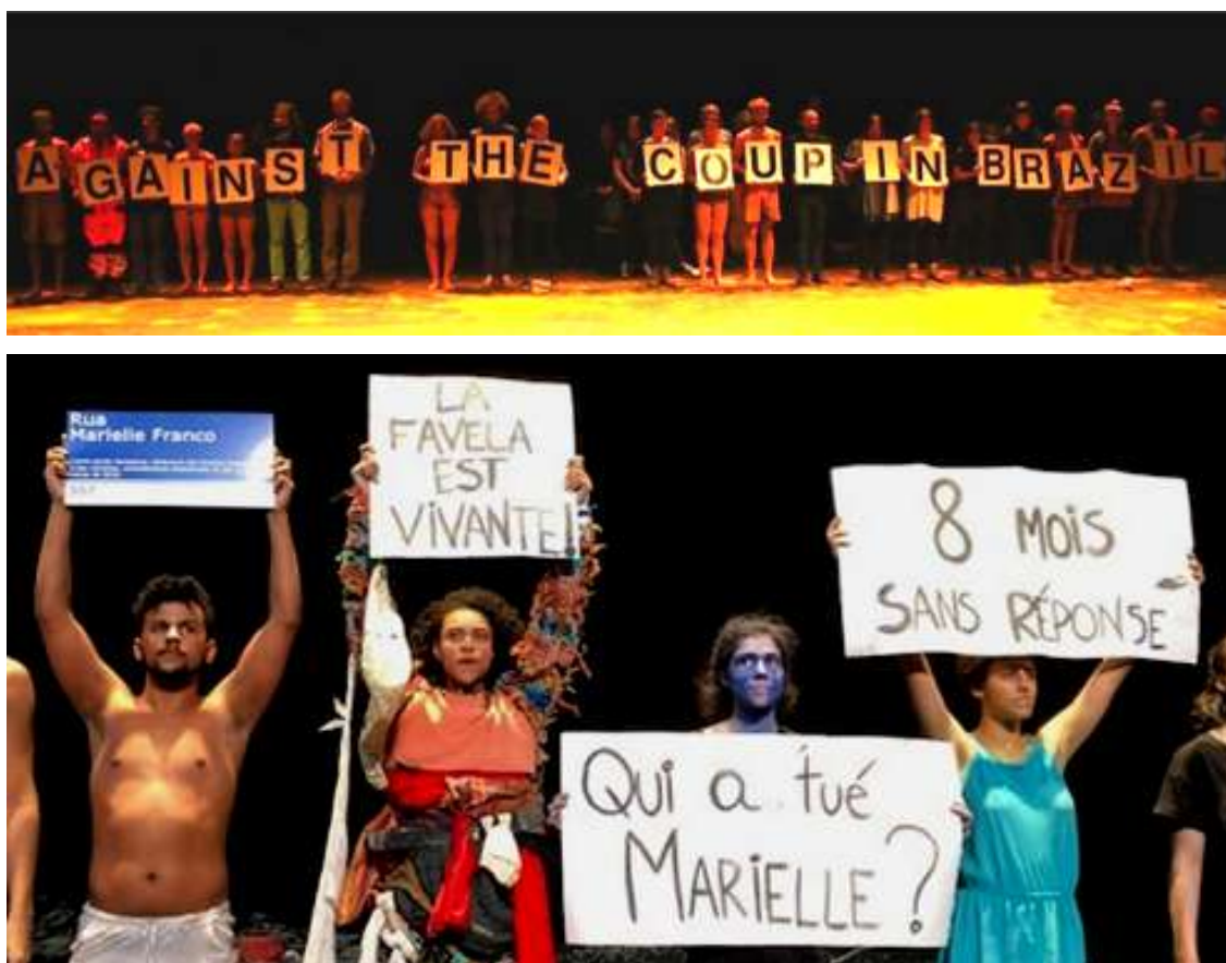
Image 2. Les danseurs de Fúria avec des affiches à la fin de deux présentations.

En plus d'irriguer leurs pratiques chorégraphiques de leurs convictions sociales, les deux chorégraphes se sont installés dans des contextes sociaux défavorisés — Maguy Marin dirige le CCN de Rillieux-la-Pape, en banlieue lyonnaise depuis 1998, tandis que Lia Rodrigues travaille toujours au CAM, au sein de la favela de Maré. Selon Maguy Marin, « la danse est un instrument politique, et elle doit être utilisée de cette manière, surtout aujourd'hui 42 ». Bien que les contextes géo-socio-politiques soient complètement différents entre la banlieue de Lyon et la favela de Rio de Janeiro, Lia Rodrigues déclare : « Ma rencontre avec Maguy a changé mon regard, elle m'a transformée. [...] et cela a sans doute contribué à mon engagement dans cette favela . Je ne change pas la réalité, mais je change des petites choses dans cette réalité 43 ». L'on voit que cette rencontre résonne sur cette perspective de la danse comme une possibilité de transformation sociale.