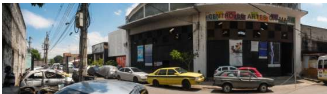
Image 1. Entrée principale du CAM – Centre d'arts de Maré.