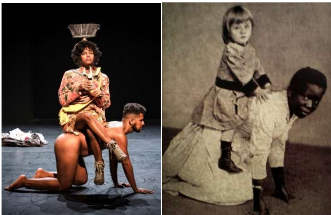
Image 28. Photographie datant de la fin du XIX e siècle. Auteur inconnu.