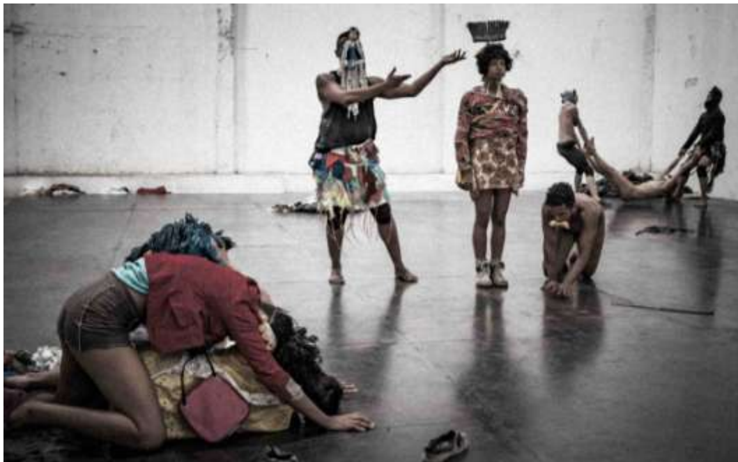
Image 35. Fúria. Trois partitions simultanées sur scène.

sont caractérisés de façon presque identique du début à la fin (comme la danseuse peinte en bleu), le corps collectif est en constante métamorphose. Les principales ressources chorégraphiques pour maintenir la fugacité du collectif utilisent la simultanéité et le chevauchement des partitions (Image 35).