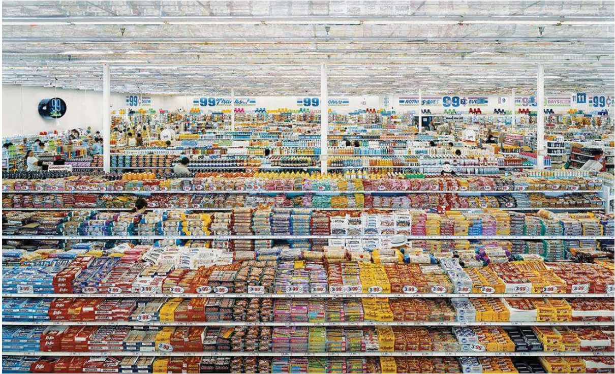
99 Cent II

Andreas Gursky, 99 Cent II , 1999/2009 C-Print, diasec 207 x 325 x 6.2cm