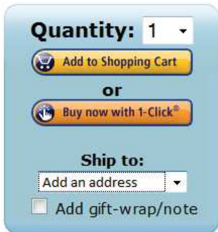
Le bouton Buy Now en 1998

spécifique dès l'étape de l'achat 173 . Rapidement est apparu un compte à rebours affiché en vert, indiquant à l'utilisateur qu'un temps imparti devait être respecté s'il souhaitait obtenir le produit dans de brefs délais. Depuis peu, le symbole graphique qui accompagne le bouton Buy Now a changé. D'une main qui clique sur un point virtuel, l'icône représente désormais un signe triangulaire orienté vers la droite, semblable à un signe de lecture que l'on peut retrouver sur les DVD ou services de vidéo en ligne.