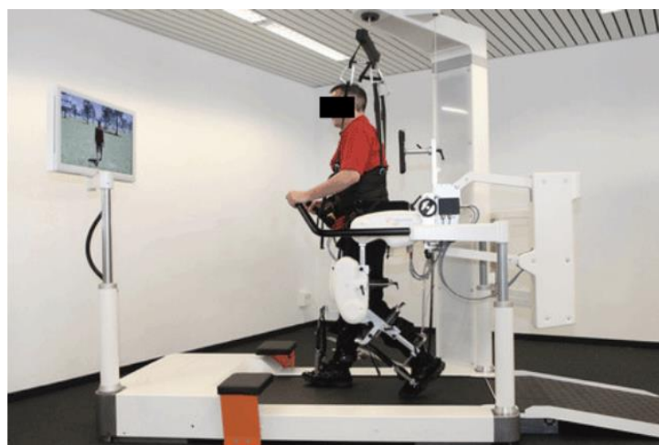
Figure 3 : Le Lokomat [35].

Ces outils sont principalement représentés par le Lokomat (Hocoma, Suisse). Il s'agit d'un dispositif de marche sur tapis-roulant avec un système d'allègement corporel et un système exosquelette qui entraîne les mouvements de l'ensemble des membres inférieurs. Le taux de support du poids du corps, la vitesse de marche, la force de guidance (aide apportée par les moteurs pendant la marche) et les secteurs articulaires de la hanche et du genou, sont paramétrés par ordinateur. Ce système comprend également un écran qui renvoie un feedback visuel au patient.