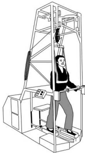
Figure 1 : Le Gait Trainer [35].

Le robot G-EO (Reha Technology, Suisse) fait également partie de ces outils à effecteurs terminaux. Cet appareil est muni d'un harnais qui permet d'alléger le poids du corps pendant la marche. Il comporte également des effecteurs terminaux qui sont deux plateformes librement programmables sur lesquels reposent les pieds. Ces plateformes permettent de reproduire n'importe quel modèle de marche, y compris la montée et la descente d'escaliers. Le système d'engrenage à bascule permet aux plateformes de simuler de manière répétitive une véritable marche hors sol.