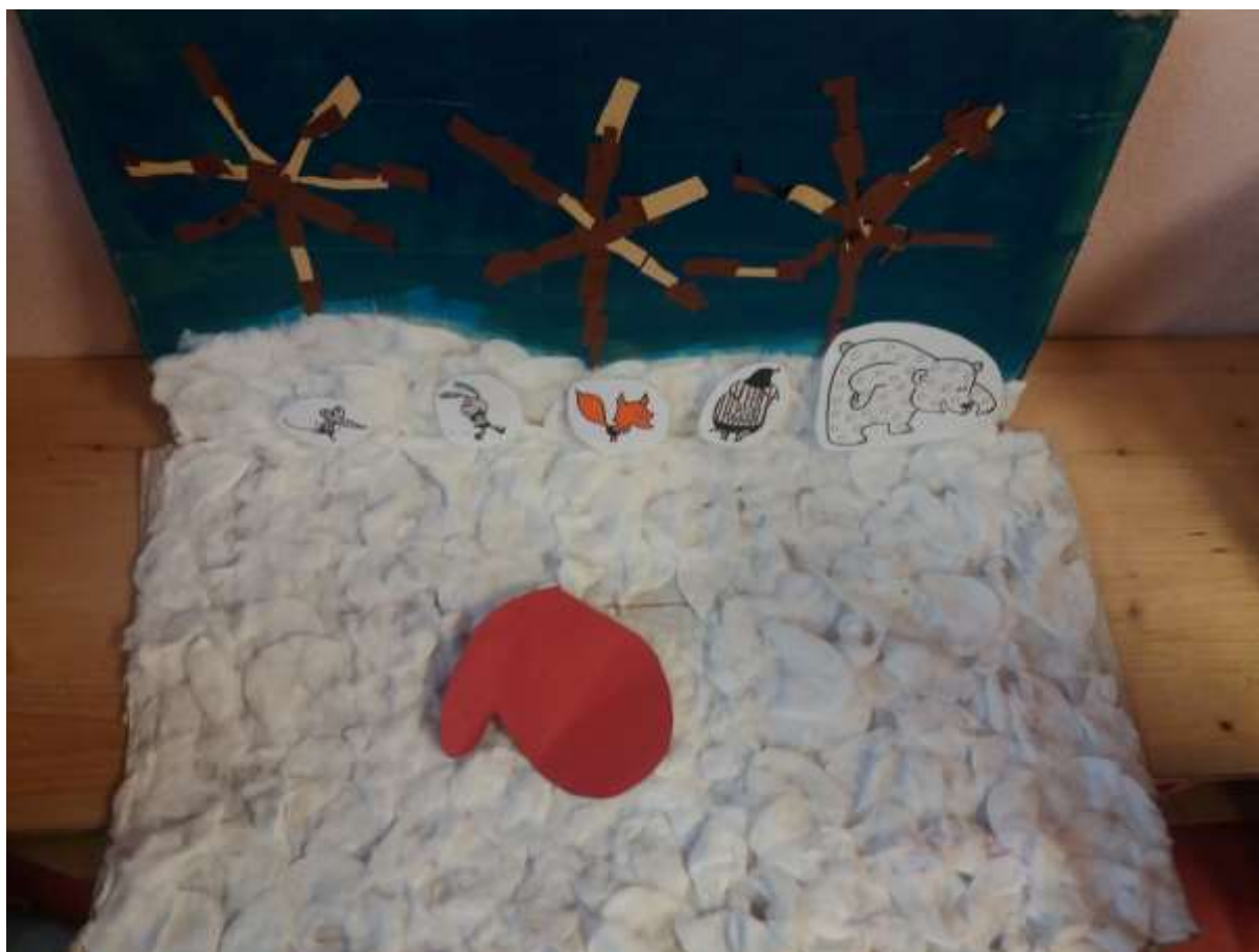
Annexe 3 : Photo du tapis de racontage réalisé par les élèves en APC