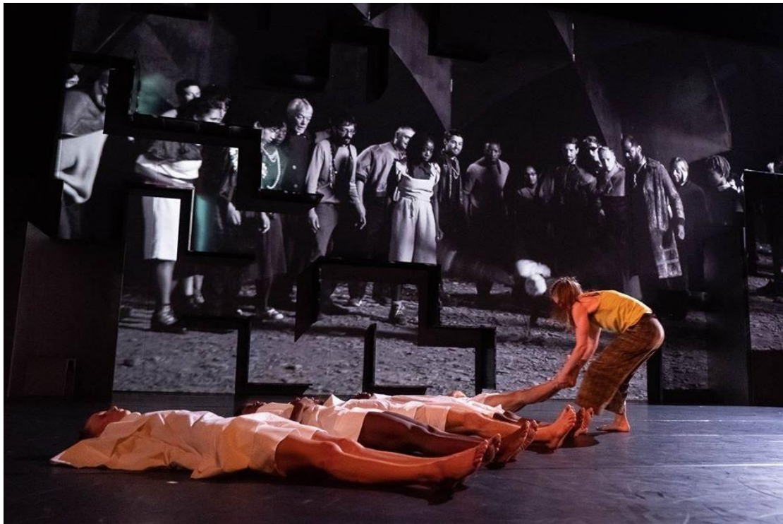
Figure 9 : Wim Vandekeybus, TrapTown , © Danny Willems, https://www.dannywillems.com/8043379 .

Dans la prochaine séquence, Marduk quitte le plateau avec un sac à dos, quand le maire et les Odinés s'informent de sa décision et commencent à le chercher dans le film. Finalement, malgré le conflit éternel, la vraie cause de la mort est une série de trous inexplicables qui rongent tous ce qui se trouvent autour et sèment la mort dans toute la ville. Marduk apporte les cadavres des habitants-performeurs, qui sont habillés en blanc, sur le plateau. Sa révolution génère la colère des Odinés qui le chassent en lui lançant des pierres dans la vidéo, tombant simultanément sur le plateau. Leur rage l'amène finalement à la mort. F. A. l'apporte sereinement en avant-scène et s'adresse au public d'un ton calme qui ne fait pas sentir la tragédie de sa perte. Il essaye de dire ses dernières paroles, comme s'il était Marduk.