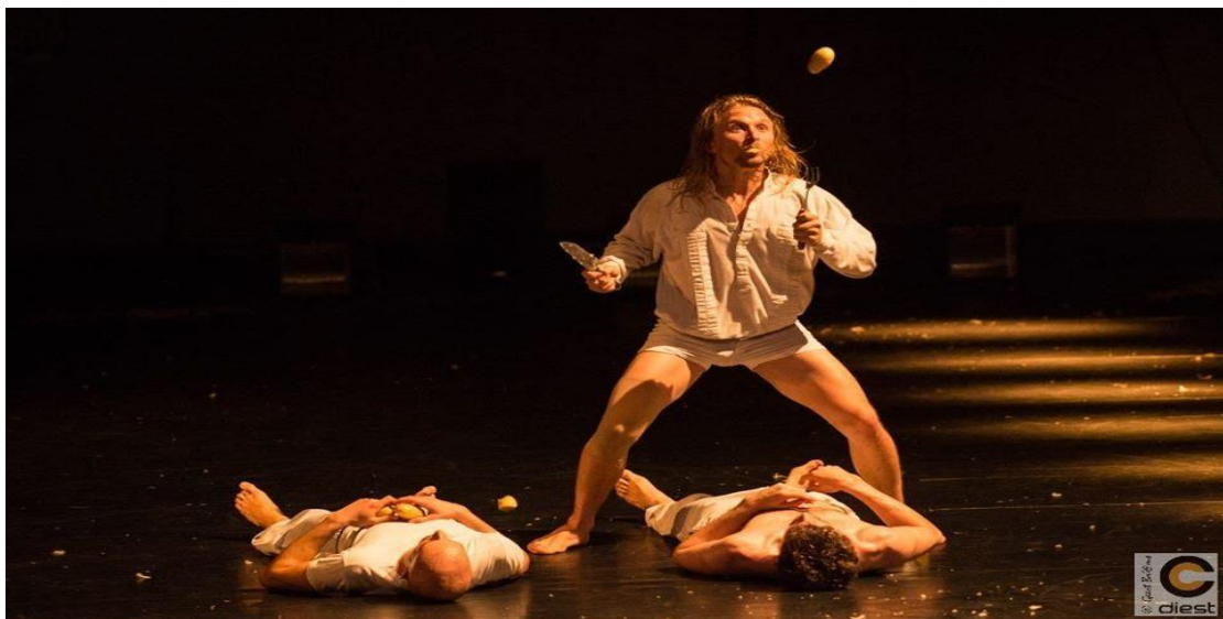
Figure 5 : Wim Vandekeybus, In spite of wishing and wanting  .

Cette tension entre eux, qui présuppose leur présence absolue, crée de nouveaux couples. Quelques danseurs sont portés par les autres de manière que l'un des deux est debout et l'autre l'embrasse avec ses pieds. De cette position, il met la moitié de son corps hors sol et l'ouvre lentement comme s'il était un oiseau en train de voler. De même, il ouvre ses bras de côté, nous faisant penser aux ailes. Ce corps penché avec ses bras ouverts montre une envie de découvrir tout ce qui se trouve autour et en même temps, transmet une sensation de liberté du corps qui surpasse ses dimensions humaines. La séance des cinq hommes sans chemises en état de vol nous surprend par la beauté et le potentiel de leur corps.