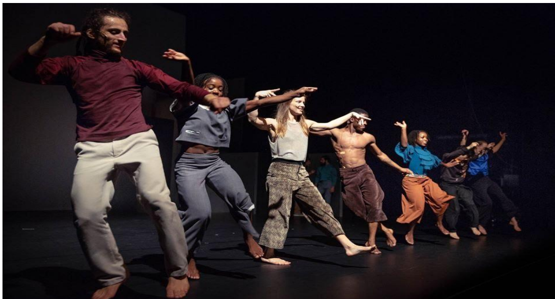
Figure 8 : Wim Vandekeybus, TrapTown , © Danny Willems, https://www.dannywillems.com/8043379 .

Il est important de souligner que Wim Vandekeybus choisit de ne pas nommer les tours de parole des performeurs comme Mythriciens ou Odinés, mais le laisse entendre au spectateur à chaque fois, selon l'évolution du récit. Cependant, cela peut porter à confusion pendant le spectacle, permettant tout de même une perception plus libre du texte. On se rend compte, ainsi, de la coexistence de deux tribus dans la même ville, dont le plateau fait l'extension. Au niveau de l'histoire, on apprend que leur conflit dure depuis quatre mille ans, à partir du moment où la colonie a été détruite. Les Odinés produisaient du lait, alors que les Mythriciens du miel. Le miel a repris sa valeur après une crise d'économie et est devenu très précieux. Les équilibres se sont bouleversés quand les Odinés ont regagné du pouvoir et ont commencé à exploiter des Mythriciens comme s'ils étaient des servants.