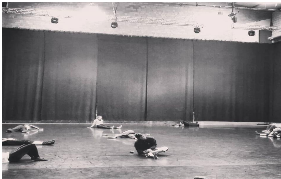
Figure 11 Ultima Vez studio, photo prise pendant le workshop.

découverte pour quelque chose 66 ». Il nous invite à enlever nos chaussettes et ainsi, la première sensation naturelle commence avec le contact direct des pieds nus au sol.