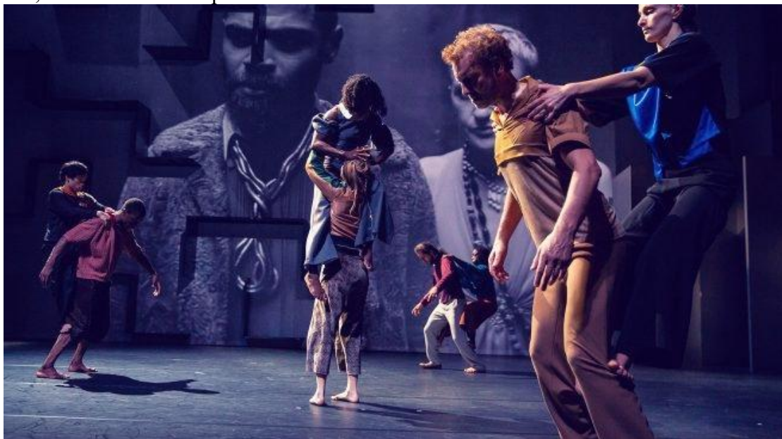
Figure 7 : Wim Vandekeybus, TrapTown , © Danny Willems, https://www.dannywillems.com/8043379 .

Jerry Killick reste dans le plan et continue à parler autour de la ville et ainsi, initie-t-elle la vraie histoire du spectacle. Cette séquence donne le relais aux performeurs qui se dispersent sur tout le plateau et commencent une danse en duo, principalement par couple homme-femme. La porte qui était au milieu change pour se mettre de côté leur permettant, ainsi, d'envahir tout l'espace.