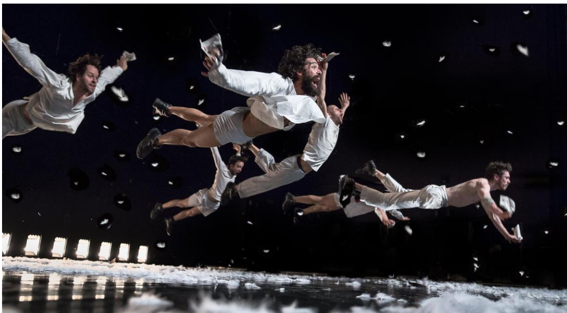
Figure 6: Wim Vandekeybus, In spite of wishing and wanting.

La foule des danseurs qui l'entourait se disperse, ainsi que la tension énergétique qui avait suscité la scène précédente. On voit le plateau dépouillé, se remplir de plumes sous une lumière bleu foncé. Cette luminosité nous permet successivement de reconnaître les performeurs qui sont allongés sur le sol du plateau. Avec leurs sous-vêtements et une chemise aussi blanche, ils commencent à bouger en se décollant lentement dans un effort de s'élever vers le ciel. Au début, ils tirent leurs pieds et leurs mains et ensuite, ils commencent à tourner en se détachant du sol jusqu'à ce qu'ils s'allongent tous avec leur poitrine sur le sol et leur bras ouverts. L'observateur, Yassin Mrabtifi, quitte le plateau en regardant ses créatures mystérieuses qui semblent inconnues et étranges pour l'homme. Avec leurs bras et des mouchoirs blancs dans leurs mains, ils font des battements d'ailes. Les performeurs commencent à trembler pour préparer leur vol. Dix hommes, entourés par des plumes, se décollent successivement du plateau en s'éclatant en l'air pour retourner au sol, comme les oiseaux qui essaient d'apprendre à voler. C'est presque magique de les voir palpiter pleins de joie et d'extase. La sensation onirique que nous a créé cet univers arrive maintenant à son sommet.