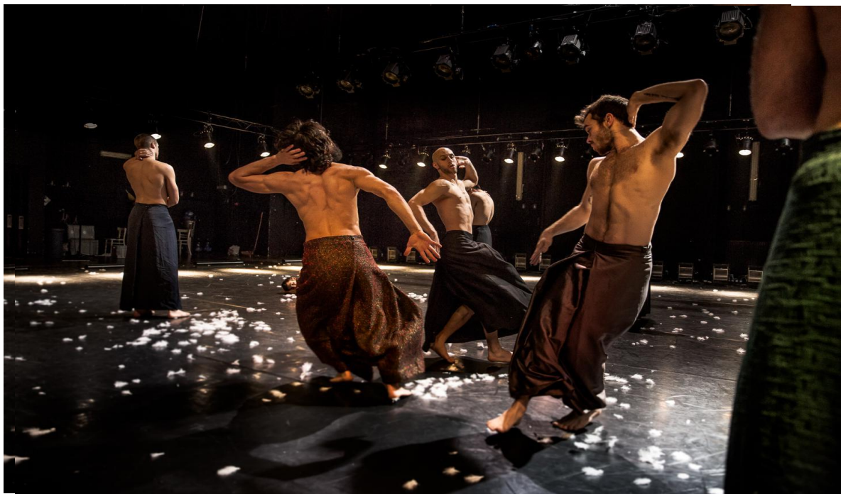
Figure 3 : Wim Vandekeybus, In spite of wishing and wanting , © Danny Willems, https://www.dannywillems.com/8043379 .

Ils restent debout, les yeux fermés, comme s'ils dormaient. Successivement, chacun à son rythme, commence à se réveiller. Ils ouvrent d'abord les yeux, tout étonné, comme si quelque chose, comme un insecte, avait pénétré leurs corps. Ensuite, ils se mettent dans un mouvement en solo aux gestes spontanés et impulsifs en essayant de se débarrasser de ce qui les gêne. On voit un corps se tirer et tourner autour de son axe de manière presque épileptique. Le mouvement continue toujours sans cesse et fait chaque « rêveur » voyager sur le plateau. Quelques danseurs tournent en l'air en spirale et atterrissent sur terre pour se relever par la suite. Leur danse commence toujours par un tour autour de leur axe pour s'ouvrir vers l'espace et les autres.