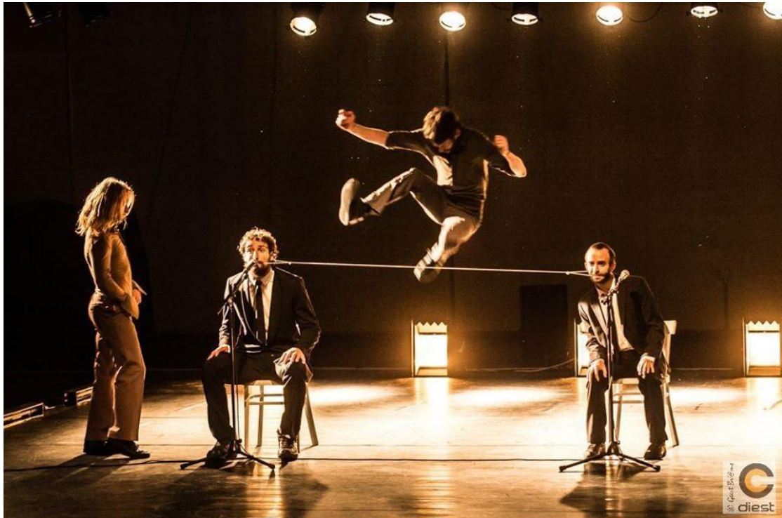
Figure 1 : Wim Vandekeybus, In spite of wishing and wanting , ©Cultuurcentrum Diest, https://www.facebook.com/pg/cultuurcentrumdiest/about/?ref=page_internal .

commencent à remplir la scène d'une énergie vorace. Cette course au galop nous fait plonger dans un univers presque bestial.