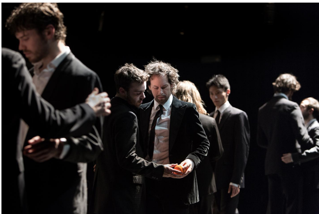
Figure 12, Wim Vandekeybus, In spite of wishing and wanting , ©Danny Willems, https://www.dannywillems.com/8043379 .

reconnaître le tango dans le début de cette séquence, avant que la danse se délibère encore de tout code, pour mener le duo dans un nouveau délirium.