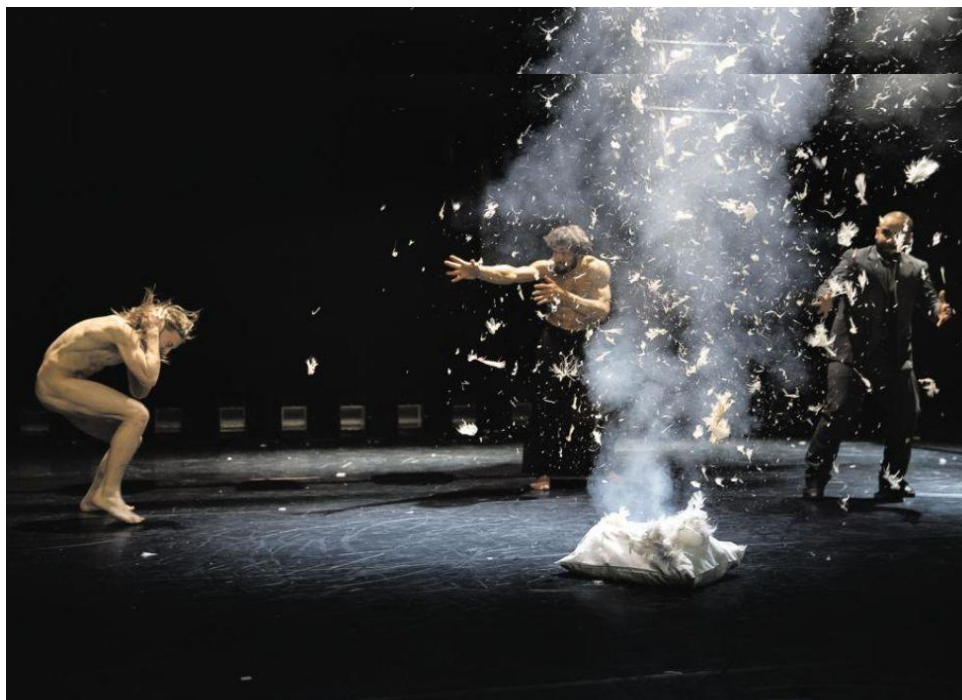
Figure 2 : Wim Vandekeybus, In spite of wishing and wanting