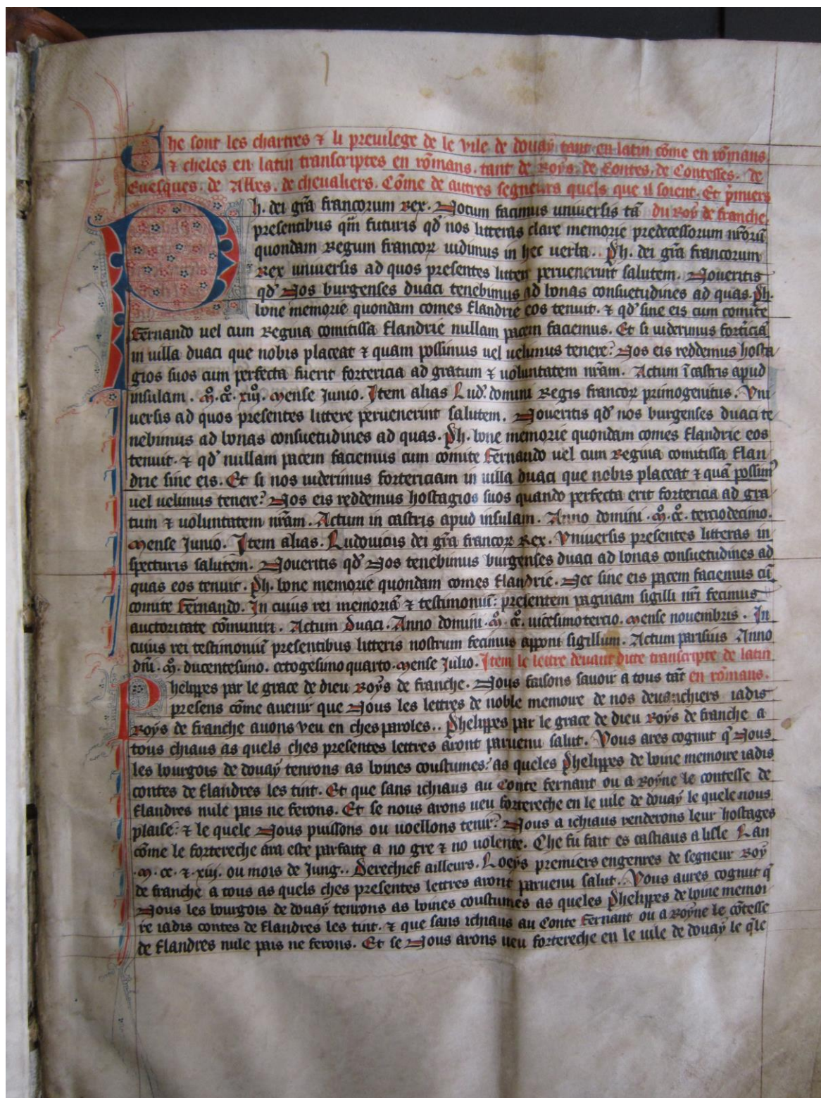
Photographie du folio 01 recto.