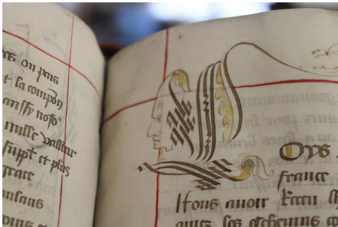
Photographie de du folio 80 recto. Détail sur l'initiale cadelée et figurée.